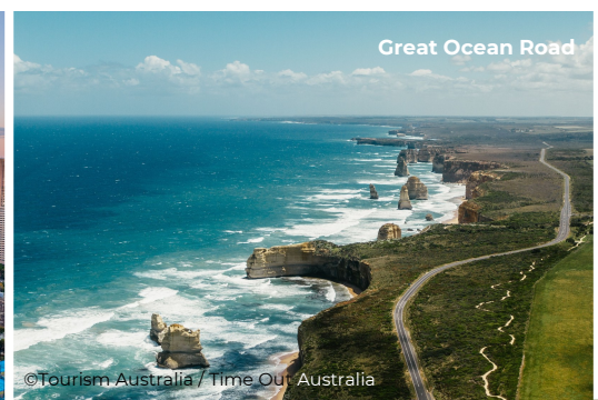
Great Ocean Road