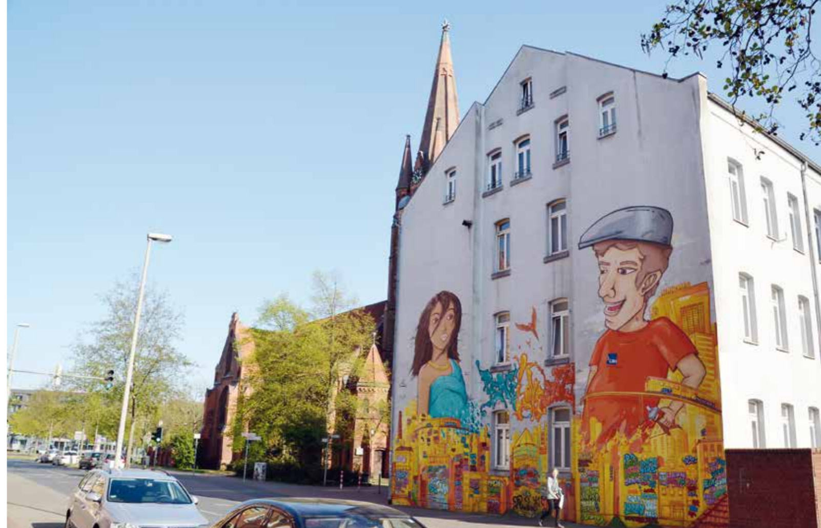
Linden hat viele Kontraste: Graffiti als Stadtteilprojekt des 21. Jahrhunderts neben der um 1880 erbauten Erlösekirche.

Wenn Sie im „Lindener Telefonbuch“ der nächsten Ausgabe stehen wollen, schreiben Sie einfach eine E-Mail an henze@madsack-agentur.de .