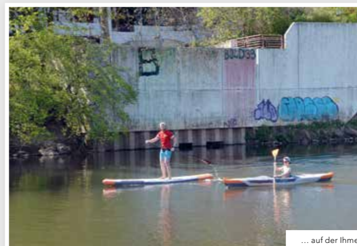
... auf der Ihme ...