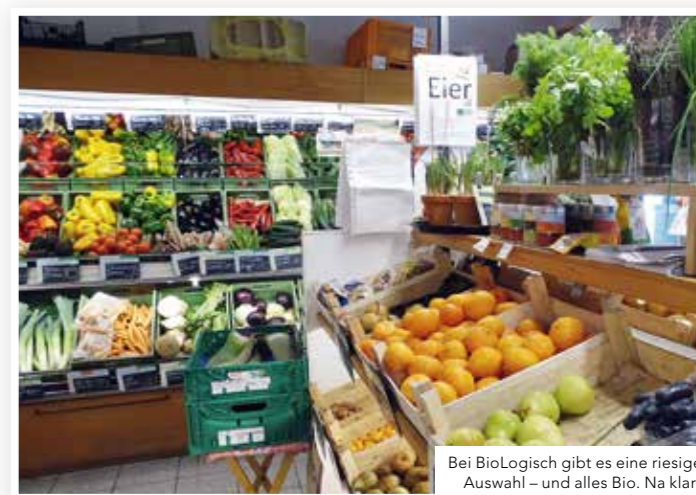
Bei BioLogisch gibt es eine riesige Auswahl – und alles Bio. Na klar!