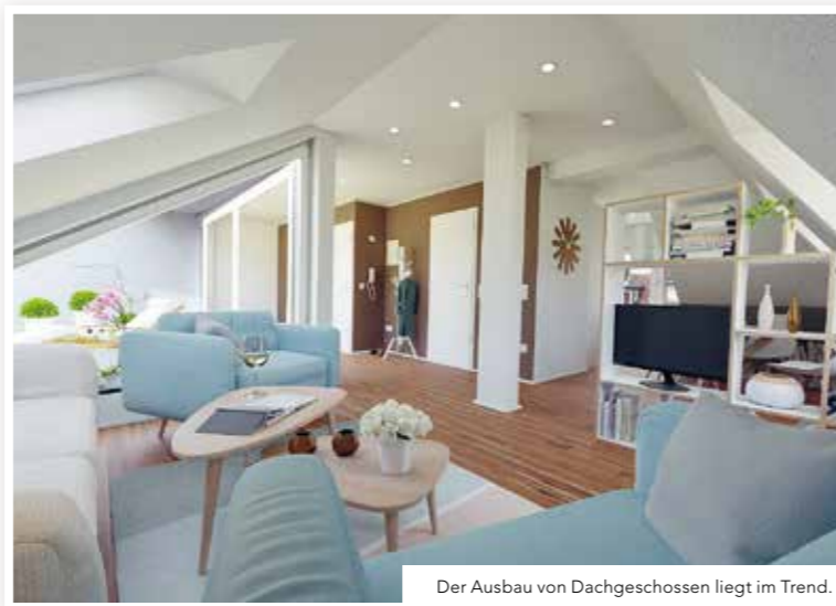
Der Ausbau von Dachgeschossen liegt im Trend.