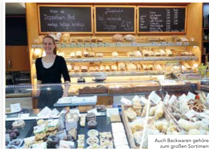
Auch Backwaren gehören zum großen Sortiment.

Schank- und Speisewirtschaft H. Rackebrandt Brauhofstraße 11 30449 Hannover Telefon 0511-442610 www.rackebrandt-hannover.de