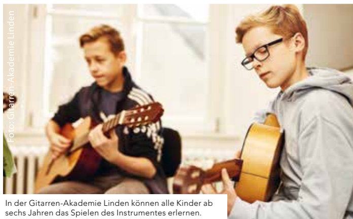
In der Gitarren-Akademie Linden können alle Kinder ab sechs Jahren das Spielen des Instrumentes erlernen.

Gitarren-Akademie Linden Eleonorenstraße 8 30449 Hannover Telefon 0511-5394517 info@gitarren-akademie-linden.de www.gitarren-akademie-linden.de