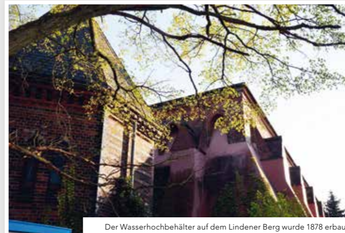
Der Wasserhochbehälter auf dem Lindener Berg wurde 1878 erbaut.