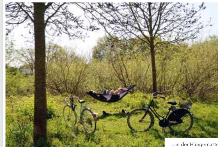
... in der Hängematte ...

Mehr Informationen unter www.lebensraum-linden.de , www.quartier-ev.de und www.linden-lockt.de . Die Betreiber der Webseites kennen Linden bis in den kleinsten Winkel und werden nicht müde, die Sehenswürdigkeiten, Tourentipps und News online zu stellen. sd