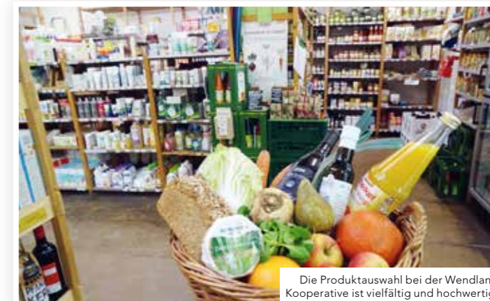
Die Produktauswahl bei der Wendland Kooperative ist vielfältig und hochwertig.

anteil im Wert von 60 Euro. Für die Ladennutzung zahlt jedes Mitglied zurzeit 17 Euro im Monat. Dieser Beitrag erhöht sich für jede weitere erwachsene Person im Haushalt um 17 Euro monatlich und für maximal zwei Kinder werden 3 Euro pro Kind berechnet.