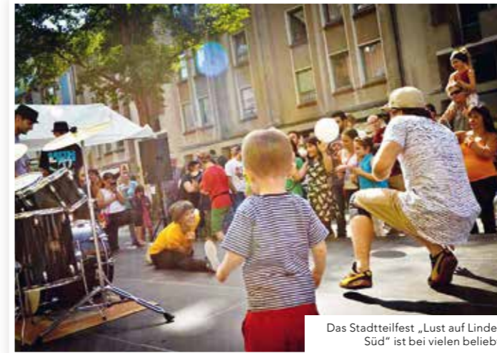
Das Stadtteilfest „Lust auf Linden Süd“ ist bei vielen beliebt.

In den letzten Jahren konnten wir viele kleine Akzente durch gemeinschaftliche Aktionen setzen. Dazu zählen unter anderem das fast schon traditionelle GreenUP im Frühjahr, wenn die Deisterstraße und ihr durch Robinnien geprägtes Straßenbild wieder nachhaltig begrünt werden. Unsere Baumpatenschaften werden durch den Deisterkiez aktiv unterstützt. Für uns ist das GreenUP der Startschuss für die neue „Freiluftsaigon“. Wir wollen somit unseren Beitrag zu mehr Natur in der Stadt leisten.