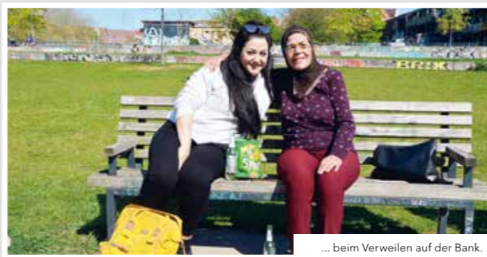
... beim Verweilen auf der Bank.