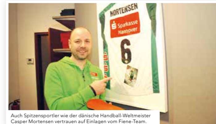
Auch Spitzensportler wie der dänische Handball-Weltmeister Casper Mortensen vertrauen auf Einlagen vom Fiene-Team.

Senso Motorik Zentrum Hannover Fiene Gesunde Schuhe Deisterstraße 52 30449 Hannover Telefon 0511-440692 fiene@gesunde-schuhe.com