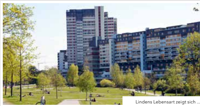
Lindens Lebensart zeigt sich ...