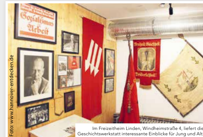
Im Freizeitheim Linden, Windheimstraße 4, liefert die Geschichtswerkstatt interessante Einblicke für Jung und Alt.

Privatpersonen, Vereine, Firmen und Institutionen sind zum Stöbern in Dokumenten und Materialien zur Stadtteilgeschichte auf der Website eingeladen. Das Angebot ist kostenfrei und ohne Werbung. sd