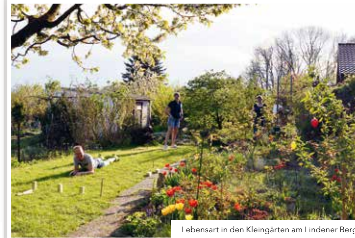
Lebensart in den Kleingärten am Lindener Berg.