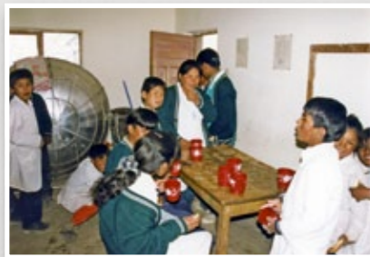
Kinder in Bolivien

Alle Kinder freuen sich auf die Ferien! Alle Kinder wollen aber auch etwas lernen und in eine gute Schule gehen können.