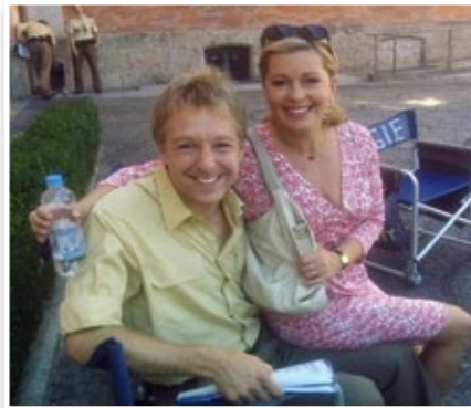
Pause bei den Dreharbeiten

»Da kam mir die Ausbildung als Opernsänger zugute: Musikalische Menschen haben auch ein gutes Gehör für Dialekte. Ich habe am Anfang stundenlang bayrische CDs und Kabarettisten angehört und am Set hatte ich auch genug Kollegen, die ich nach der richtigen Aussprache fragen konnte. Ich bin immer noch in Wien zu Hause, aber wenn ich für die Dreharbeiten hier bin, lebe ich in einem netten kleinen Hotel in München. Immerhin braucht man für zehn Filmminuten fast zehn Stunden Drehzeit, deshalb bin ich sehr viel in Bayern.«