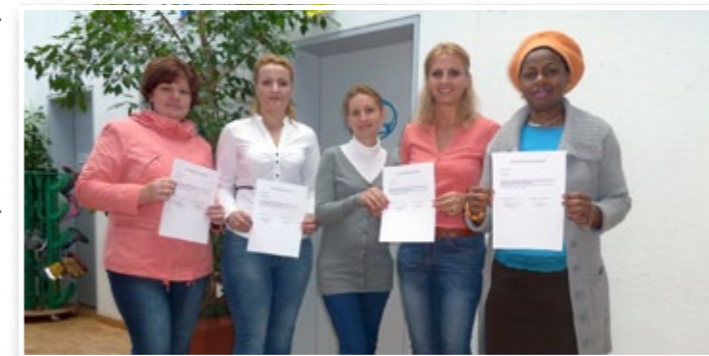
Zum Abschluss erhielten die Frauen eine Teilnahmebestätigung mit Unterschrift des Deutschlehrers

Im Rahmen der Stadtteilentwicklung Rosenheim stellte der Kindergarten Heilig Blut einen Antrag auf finanzielle Hilfe zur Durchführung eines »Deutschkurses für zugewanderte Frauen« im Stadtteil Ost.