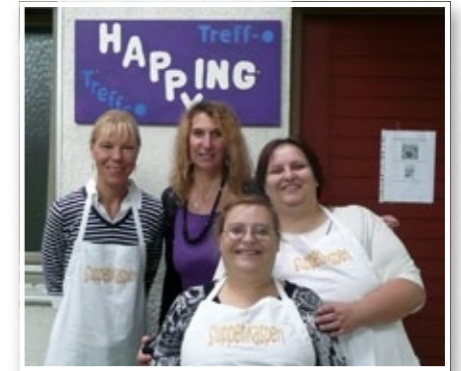
Das Team Suppenkasperl 2010

In den ersten Monaten des Projekts kamen als Gäste – wie geplant – vor allem Kinder und Jugendliche. Später hat sich der »Suppenkasperl« erfreulich weiterentwickelt: Es kamen