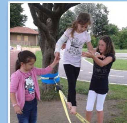
Mit großem Spaß wurde die Slackline ausprobiert

Das Rahmenprogramm gestalteten die Kinder: Eine Modenschau, bei der sie selbst gehäkelte Mützen präsentierten, ein »Linedance« sowie der »Harlemshake« begeisterten die Gäste. Die temperamentvolle türkische Tanzgruppe mit Fidan war ebenfalls sehr bemerkenswert.