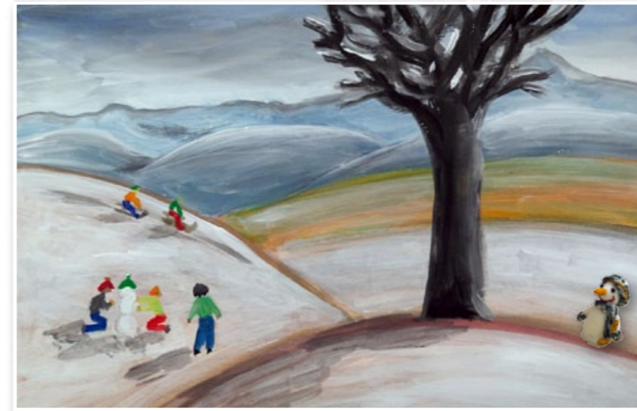
Ein Winterbild von Sabine Schmitz

Wir wünschen unseren lieben Lesern und Lesern ein besinnliches, friedvolles und gesegnetes Weihnachtsfest und einen guten Start ins neue Jahr! Die Redaktion.