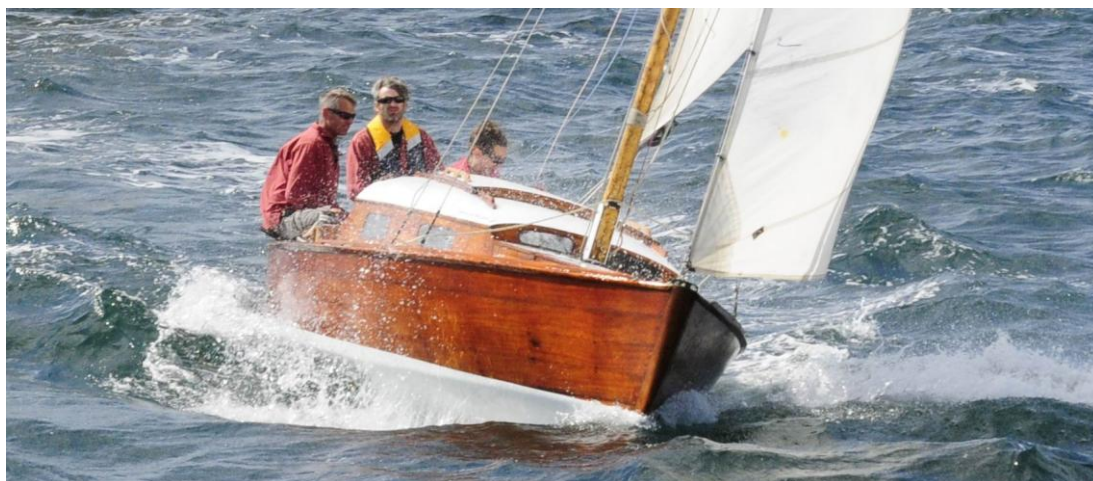
Le Bélouga Ty Barik qui a reçu le prix de l'Elégance lors des RDV de la Belle Plaisance de Bénodet en 2014

Mais l'avènement du polyester, plus aisé à entretenir, porte un coup sévère aux constructions en bois traditionnel. Les 700 unités bois seront suivies d'environ 200 constructions polyester et aluminium.