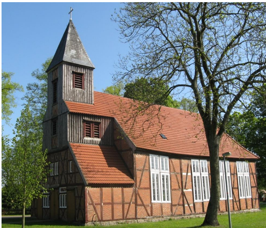
Kirche in Kirch Jesar, Landkreis Ludwigslust, Mecklenburg-Vorpommern (5.5.2008, niteshift, self2|GFDL|cc-by-3.0)

Unserer Fachwerkkirche droht Gefahr: über die Jahre hat sich ein großer Sanierungsbedarf für den Erhalt der Kirche aufgestaut, der von der evangelischen Kirchengemeinde allein nicht mehr bewältigt werden kann. Jetzt sind die Mitglieder der Gemeinden Kirch-Jesar, Moraas und Neu Klüß gefordert, die Anteil an der Nutzung des Gebäudes für kulturelle und kirchliche Zwecke haben, aber auch alle, denen die schöne Fachwerkkirche ans Herz gewachsen ist.