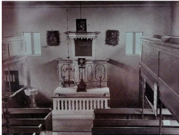
Innenraum der Kirche Kirch Jesar: Altarbereich mit Kanzelaltar vor der Neugestaltung von 1913 durch Willi Schomann

Auf Veranlassung des Mecklenburger Hofmarschalls Johann Christoph von Halberstadt, dem damals der Sudenhof gehörte, wurde an ihrer Stelle auf dem Platz in der Dorfmitte ein schlichter rechteckiger Bau mit einem Fachwerkrahmen aus Eiche und einer Ausfachung mit Klinker im Stile der "Notkirchen" errichtet. 1717 wurde zum 200jährigen Jubiläum des Lutherischen Thesenanschlags eine neue Kirche geweiht. Aus dieser Zeit stammen Wandständer, die als Figur 'Wilder Mann' gestaltet wurden, und der Kanzelaltar an der Ostwand.