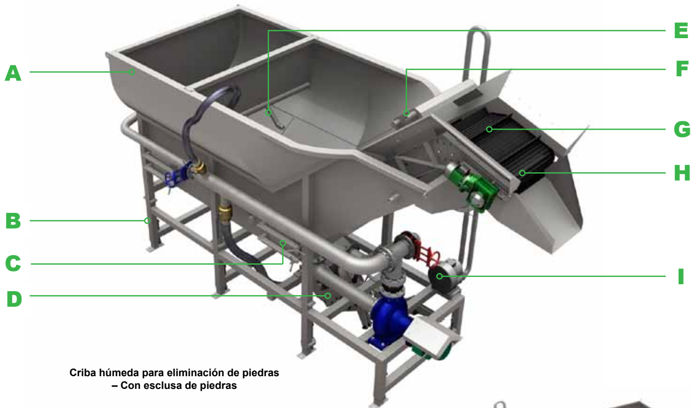
Criba húmeda para eliminación de piedras – Con esclusa de piedras