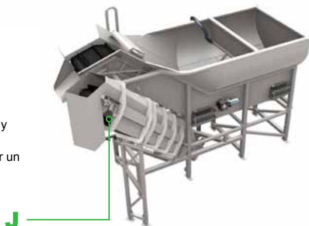
Criba húmeda para eliminación de piedras Wyma – Elevador de piedras