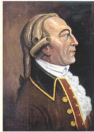
Johann Hieronymus Schroeter (1745-1816)

Der Oberamtmann Johann Hieronymus Schroeter, am 30. August 1745 in Erfurt als fünftes Kind eines Advokaten geboren, hat den Namen „Lilienthal“ in die Welt getragen wie kein anderer. Aber nicht seine eigentliche Tätigkeit, die er täglich zum Wohle der Bürger ausübte, war der Grund. Nach Dienstschluss beobachtete er im Amtsgarten die Gestirne, insbesondere