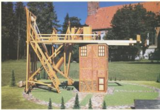
Das Modell des großen 27füßigen Teleskops Schroeters, aufgenommen auf dem Standort der großen Sternwarte im Lilienthaler Amtsgarten. Es wird im Heimatmuseum zusammen mit einigen Instrumenten Schroeters ausgestellt. Im Hintergrund die Lilienthaler Klosterkirche aus dem Jahre 1262.

Zwei feste Observatorien sowie mehrere freistehende Großteleskope, wie z. B. das 27füßige Spiegelteleskop, standen Schroeter vornehmlich für die Beobachtung der Objekte des Sonnensystems zur Verfügung.