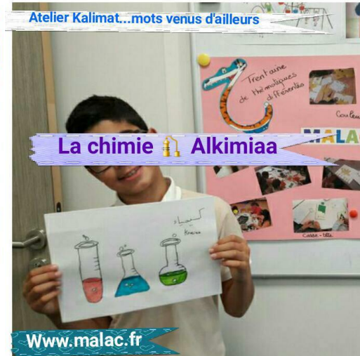
La chimie Alkimiaa