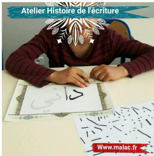
Atelier Histoire de l'écriture