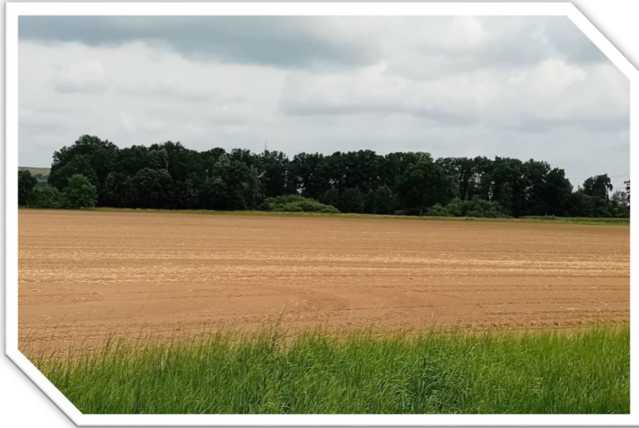
Ansicht: Logscher Teich, a. R. Loga

Von Loga nach Saritsch befindet sich linker Hand ein kleines Wäldchen, der Logsche Teich an dessen Südseite das (Hoyerswerdaer) Schwarzwasser vorbeiführt. Die ständige Zuführung von Fließwasser und die lose Bodenstruktur sorgten mit der Zeit für ein idyllisches Feuchtbiotop. Die vormalige Trockenlegung mittels Verrohren ist möglicherweise inzwischen verrottet, sodass eine landwirtschaftliche oder anderweitige Nutzung nur durch gezielte Anstrengungen möglich wäre. An der Ostseite des Wäldchens in Richtung Saritsch befindet sich der Sportplatz und angrenzend das Flurstück der Alten Schule, die zum Wohnhaus umgebaut wurde.