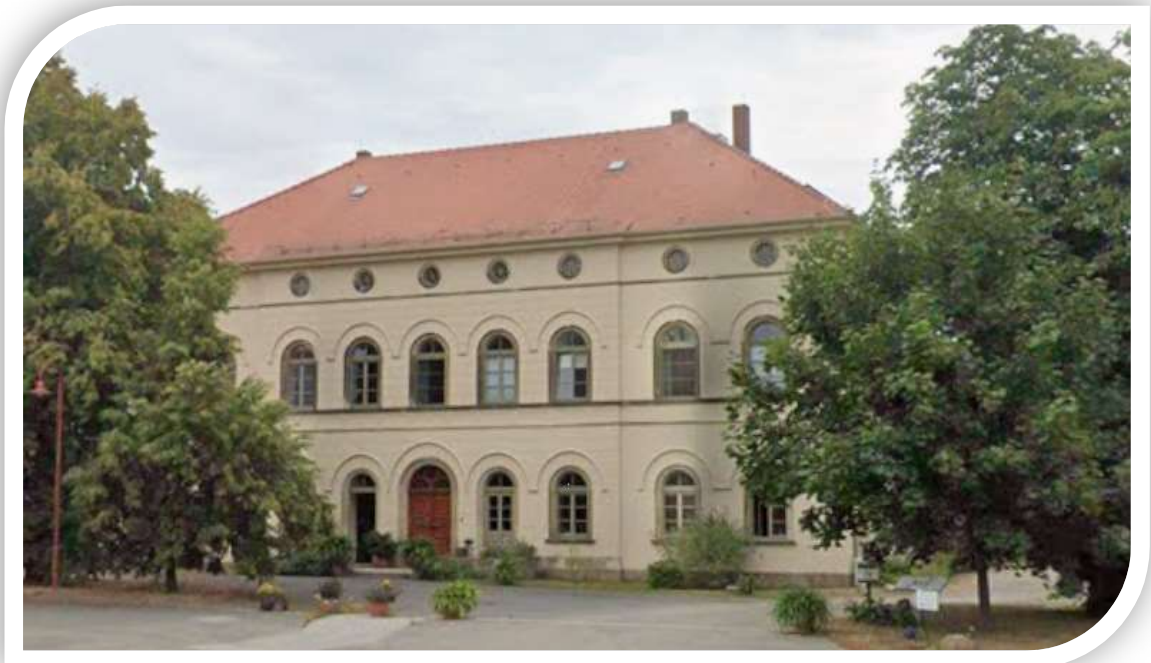
Ansicht: Herrenhaus Saritsch, Westseite

So präsentiert sich das Gebäude des Herrenhauses Saritsch wieder hergerichtet nach historischem Vorbild und setzt einen gelungenen Lebensmittelpunkt für seine Bewohner. Interessant ist zudem, das im Erdgeschoss, in den Räumen des ehemaligen Konsums, die „Konsumgalerie“ untergebracht ist. Diese besteht mittlerweile über 10 Jahre mit wechselnden Ausstellungen und ist von Mai bis September für die Öffentlichkeit zugänglich ist.