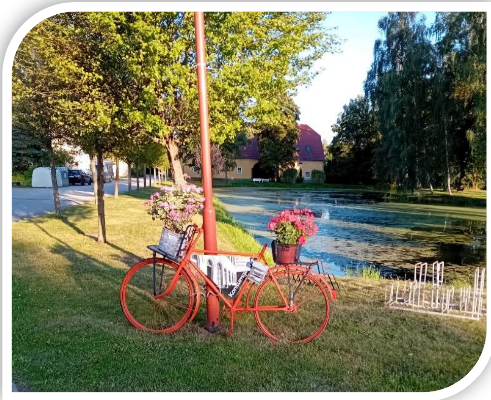
Ansicht: Dorfteich Saritsch