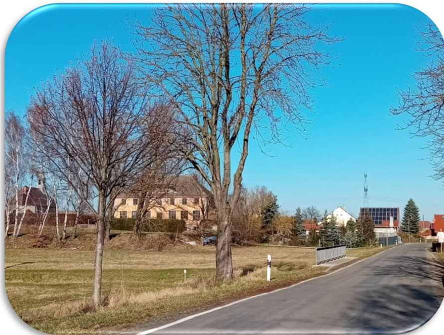
Ansicht Ortseingang Saritsch a. R. Loga