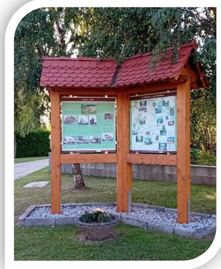
Ansicht: Infotafel Saritsch am Spielplatz