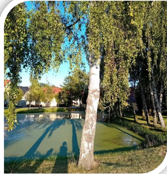
Ansicht: Dorfteich Saritsch