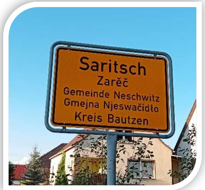
Ansicht: Ortseingang Saritsch a. R. Loga

Um 1835 ist der bis heute gültige Ortsname in Urkunden benannt.