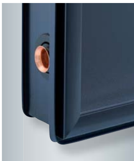
Kollektorrahmen mit speziellem Indachprofil zur Aufnahme des Eindeckrahmens