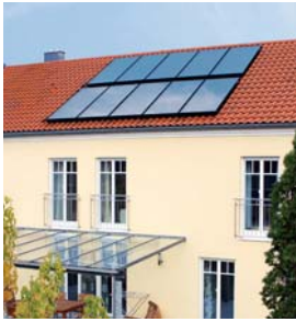
Vitosol 200-FM Zweifamilienhaus Geisenfeld