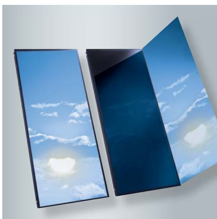
Vitosol 200-FM mit schaltender Absorberschicht ThermProtect