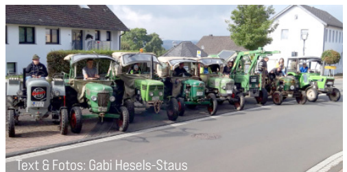
Text & Fotos: Gabi Hesels-Staus

Beim diesjährigen Traktor Pulling in Oberlauch am 10. September durften die Brandscheider Bulldog Freunde natürlich nicht fehlen. Gut gelaunt, mit frisch geputzten Bulldogs traf man sich in der Dorfmitte und startete bei strahlendem Sonnenschein nach Oberlauch.