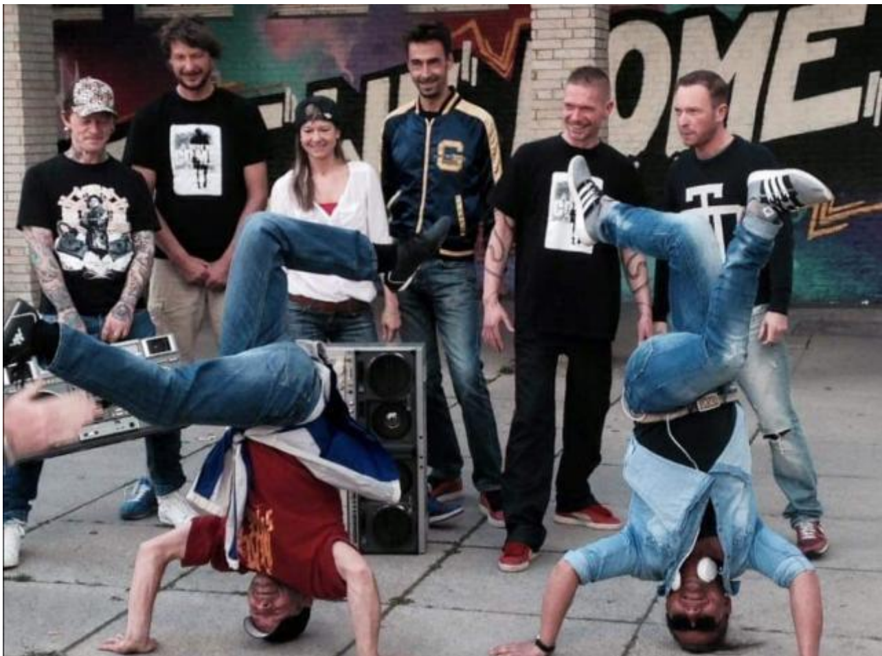
1504-Museumskreuzung - NEWKID