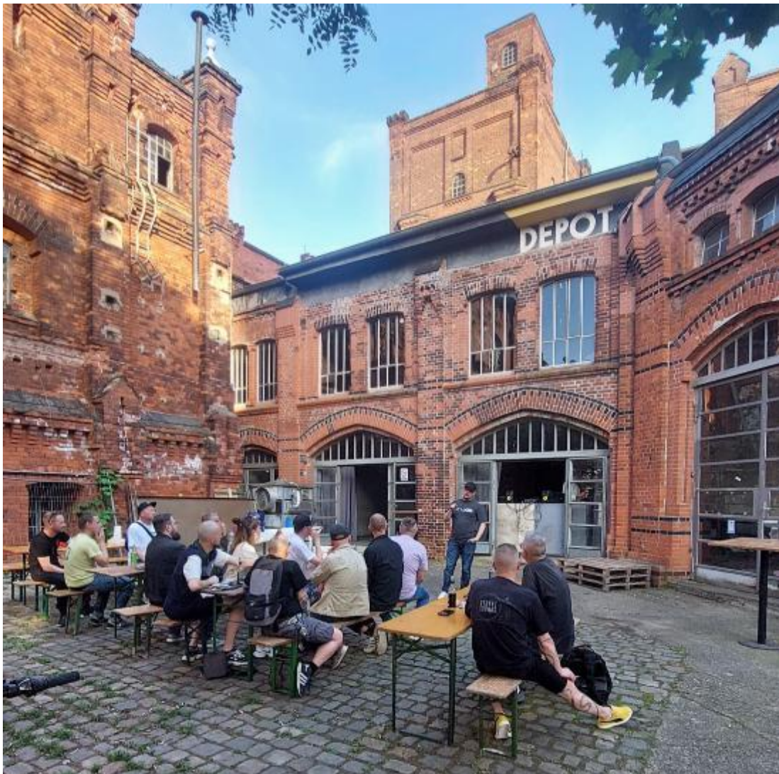
2404-Auftakt Dessau - NEWKID