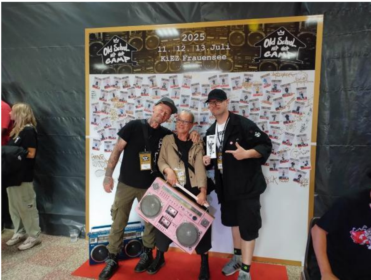
2507-2.OHHC - NEWKID