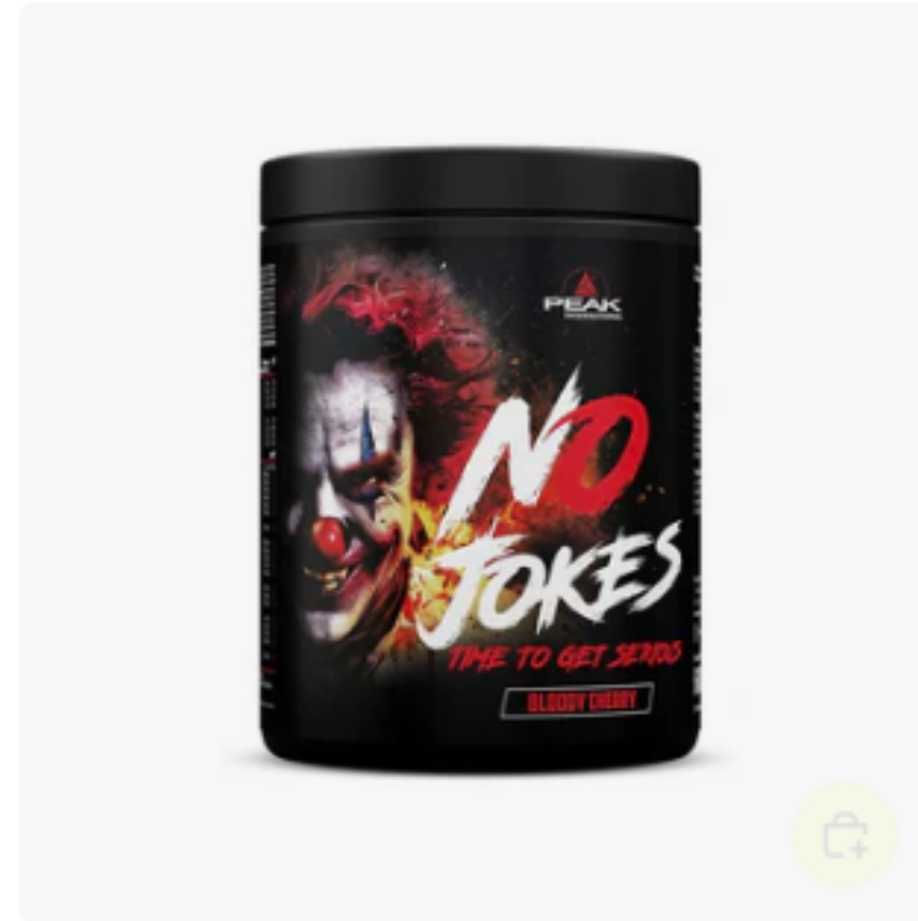
PEAK No Jokes 600g €39,95