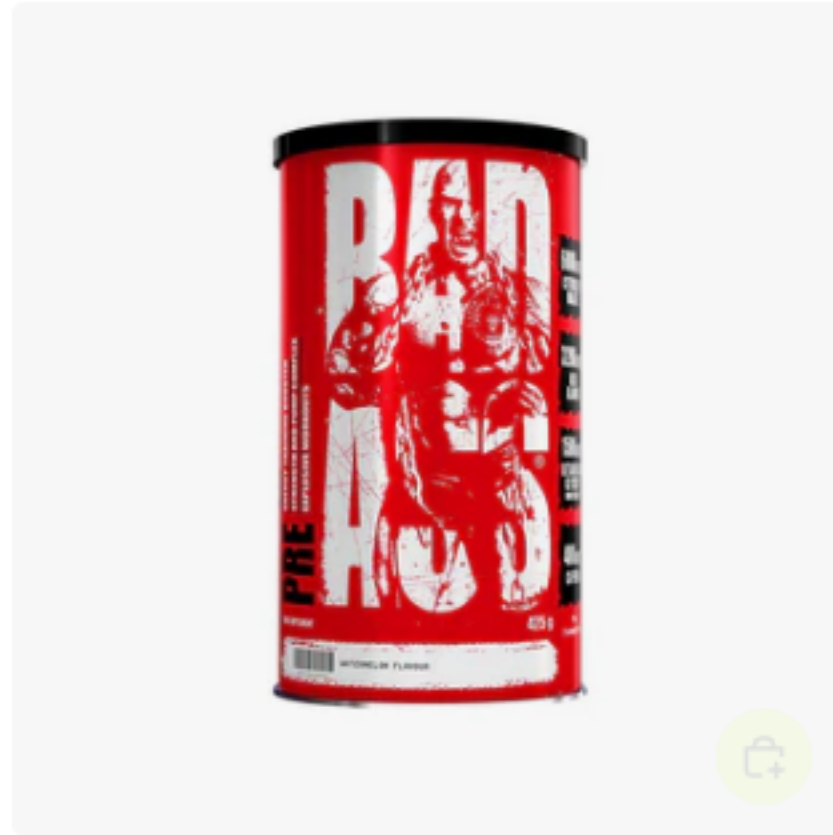
BAD ASS – PRE 425 g €29,90