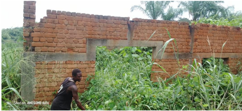
Iststand des Bauernlagers in Ikela