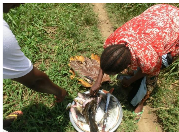
und Marktfrau in Ikela.