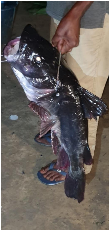
Stolzer Ertrag ...