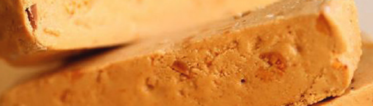
TURRÓN DE JIJONA