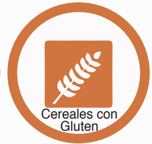
Cereales con Gluten