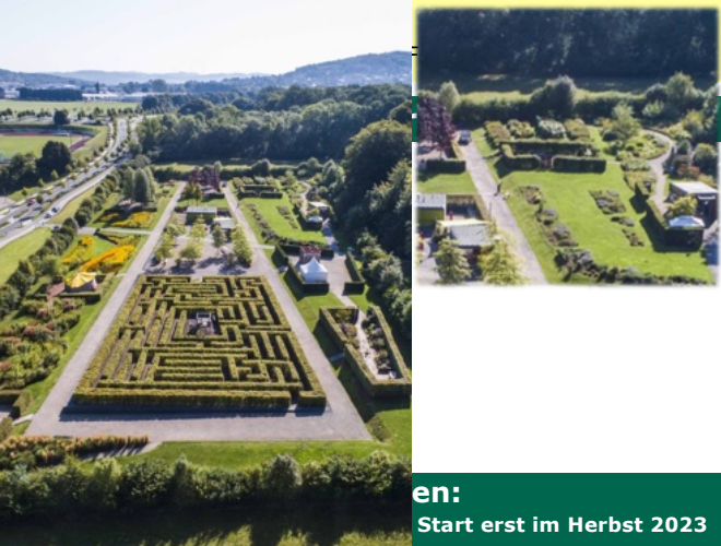
en: Start erst im Herbst 2023