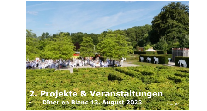
27.03.2023 Mitgliederversammlung 42