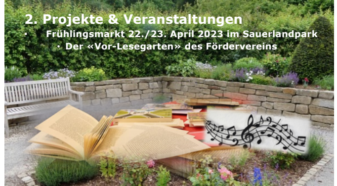
27.03.2023 Mitgliederversammlung 41