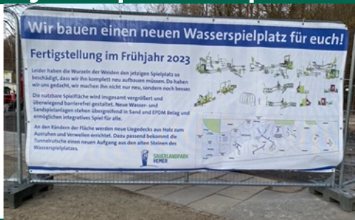
Wasserspielplatz: „kleine“ finanzielle Beteiligung durch den FV