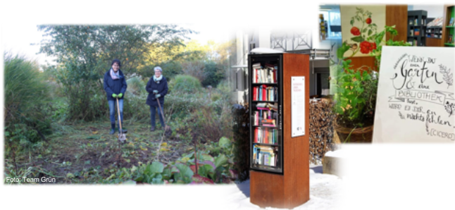
Lese-Garten: Ehemaliger Bürgerstaudengarten – Start erst im Herbst 2023