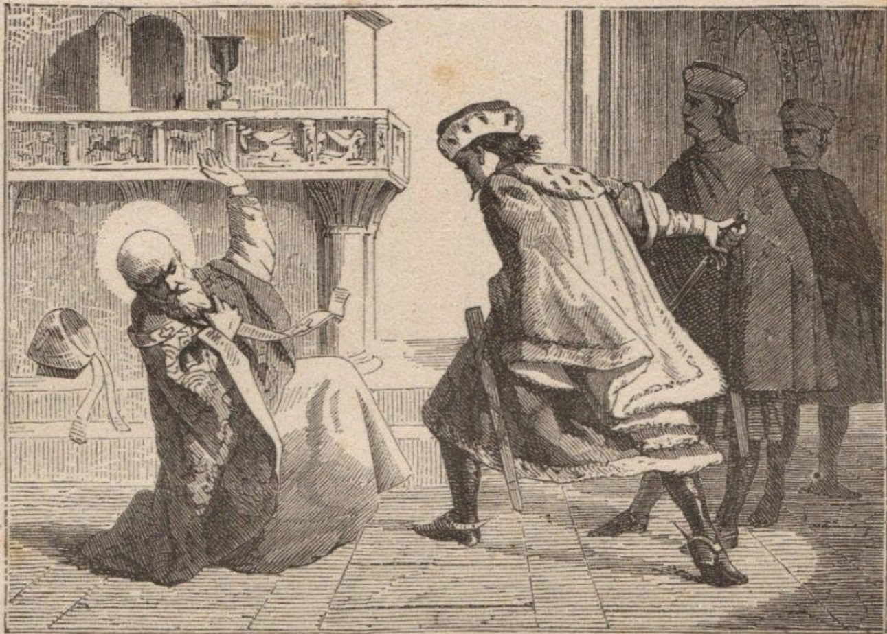
SAINT STANISLAS, ÉVÊQUE DE CRACOVIE, MARTYR