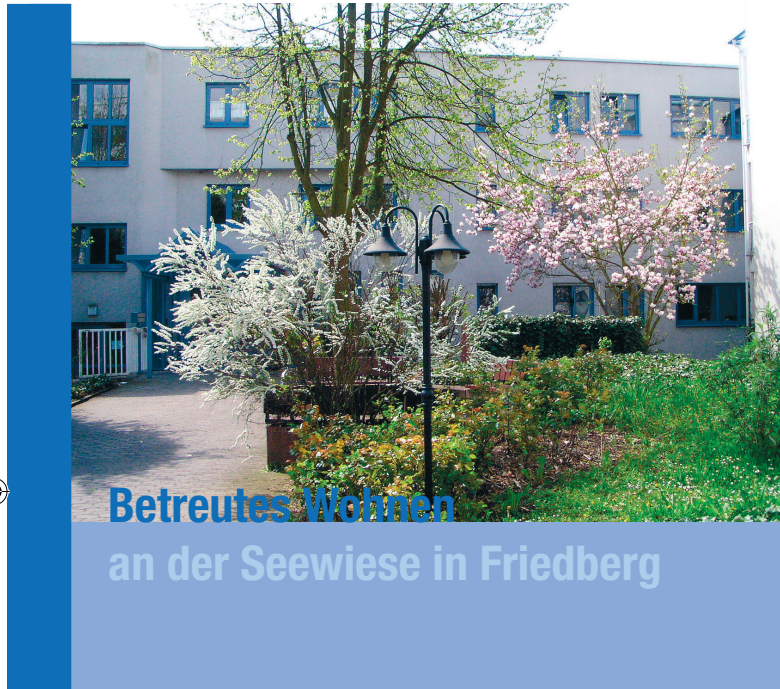
Innenhof St. Bardo