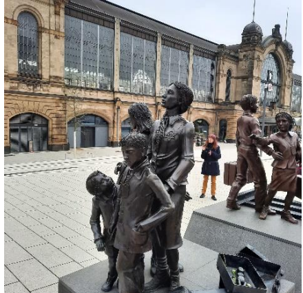
Das Denkmal „Kindertransporte – der Abschied“ haben wenige Tage später König Charles III. und seine Frau besucht. Queen Camilla legte dort weiße Rosen nieder.

Nach einem ausgiebigen Bummel durch Pflanzen und Blumen und die Wallanlagen trafen wir dann am Bühneneingang der Staatsoper auf einen Ehrenamtlichen, der uns in die Geheimnisse dieser einführen wollte. Die Oper beherbergt unter ihrem Dach die Staatsoper Hamburg, das philharmonische Staatsorchester und das Hamburg Ballett.