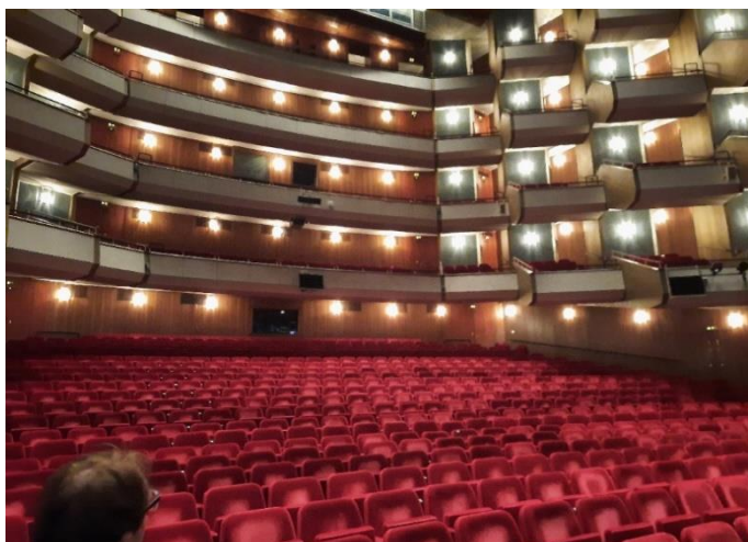
Der Blick in den Zuschauerraum der Staatsoper ist auch ohne Zuschauer beeindruckend.

bei einer nächsten Vorstellung einen ganz anderen Blick auf die Bühne hat. Leider war es nicht erlaubt, während der Führung zu fotografieren.