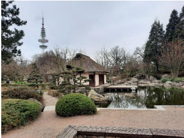
Zu jeder Jahreszeit schön: Ein kurzer oder längerer Spaziergang durch Pflanzen und Blumen.

Während der fast zweistündigen Führung gab es für uns viel Interessantes