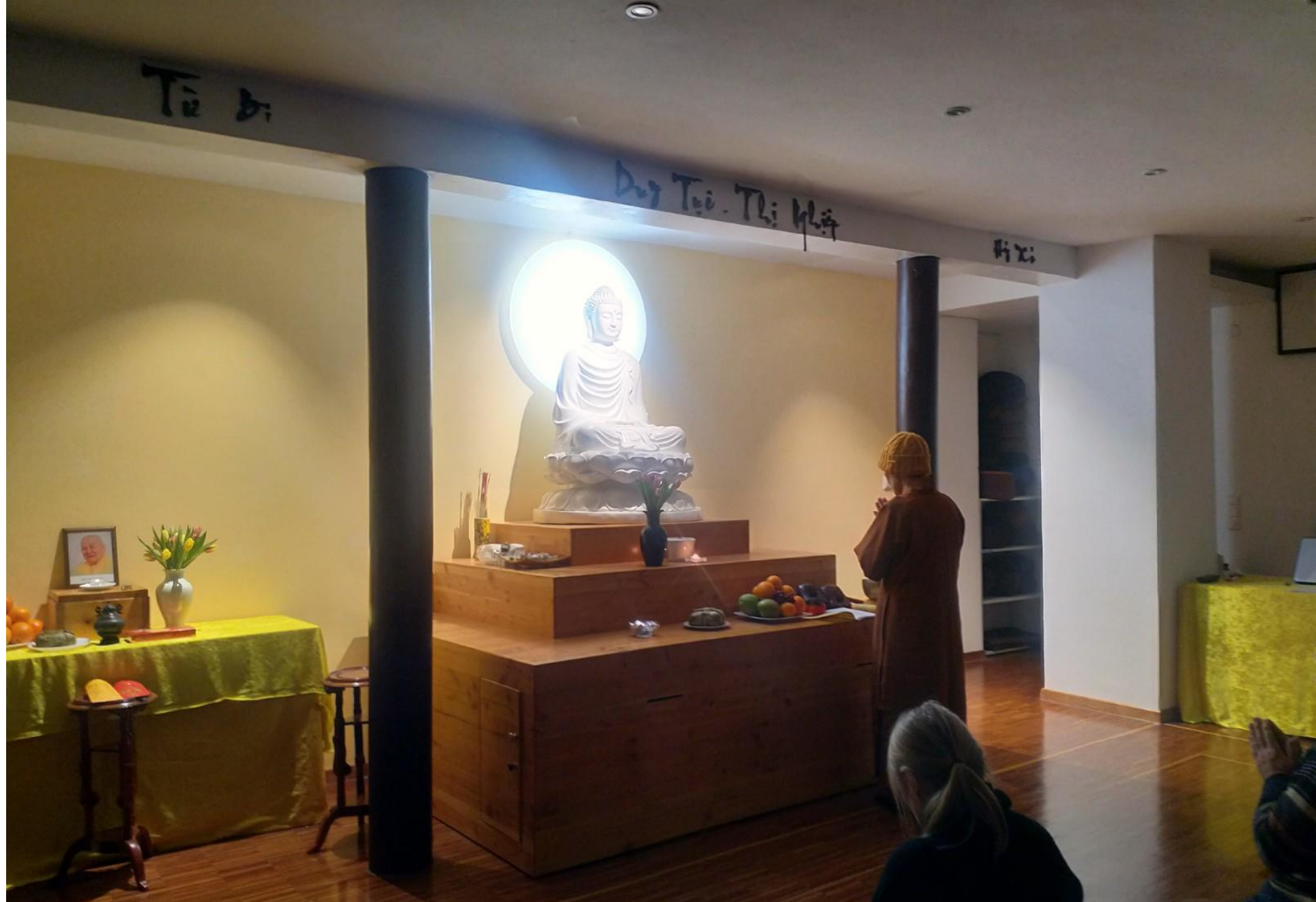
Lễ cuối năm/ Jahresendezeremonie