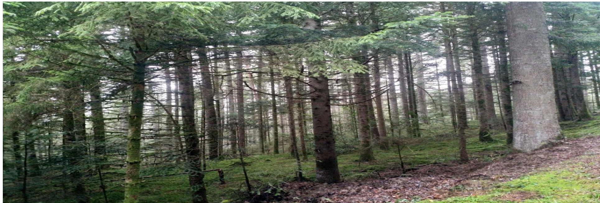
Khu rừng đen Schwarzwald black Forest