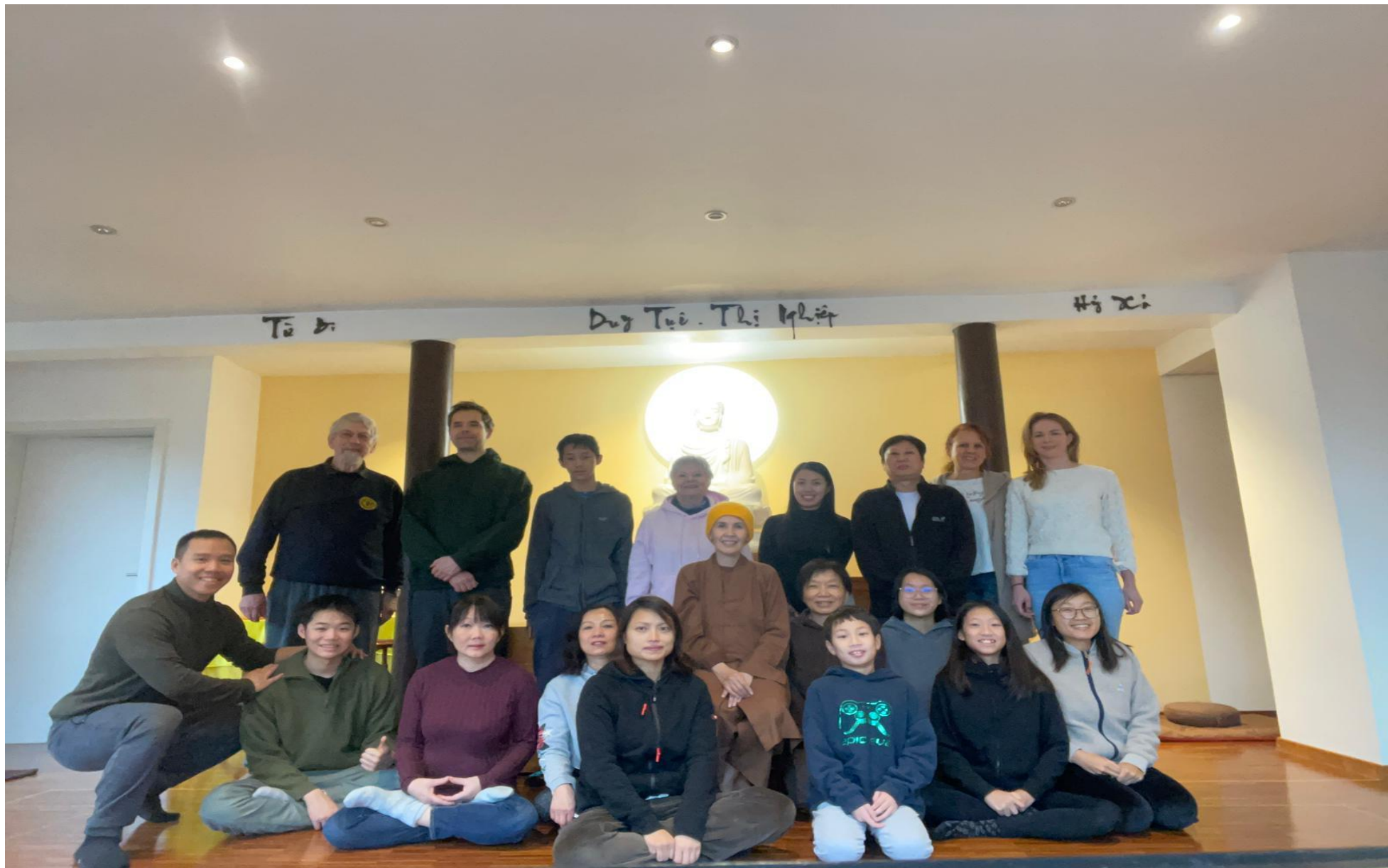
Meditation-Praxiskurs von 2.1.23 bis 6.1.23 Khoá Nhập Thất từ Thứ Hai 02.01.2023 đến Thứ Sáu 06.01.23