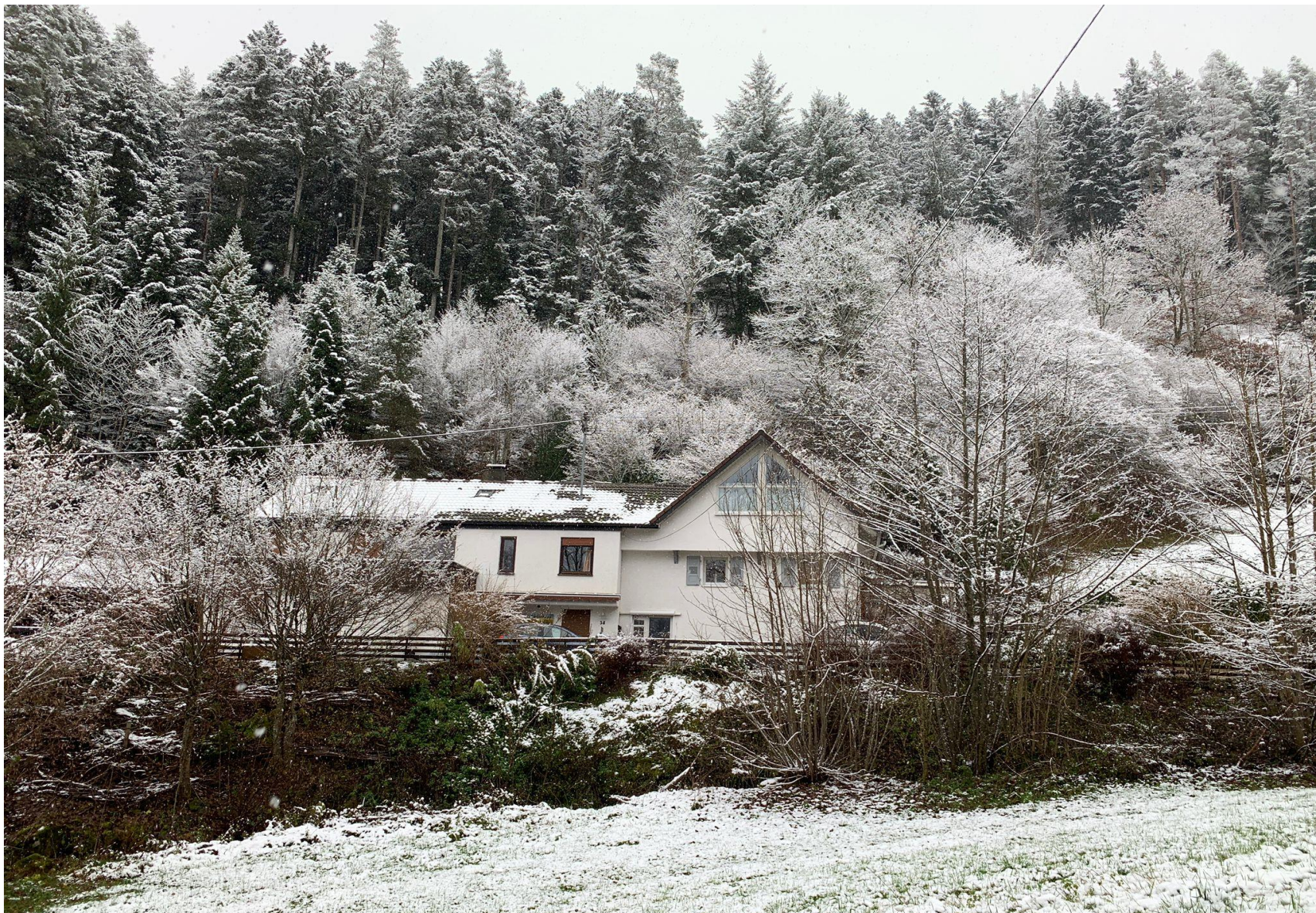
tại thiền viện Schenkenzell Meditationshaus in Schenkenzell