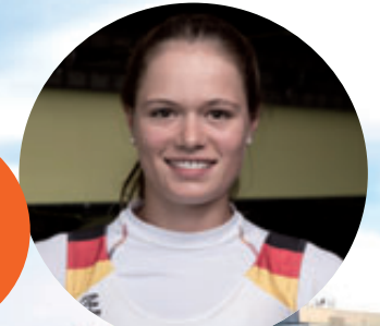
Sportliche Botschafterin Leonie Menzel Vize-Weltmeisterin 2018 Europameisterin 2019 Olypiateilnehmerin 2021

Düsseldorfer Sportlerin des Jahres 2017, 2018 & 2019