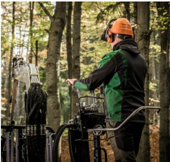
Stehplattform auf der Deichel für eine optimale Sicht.