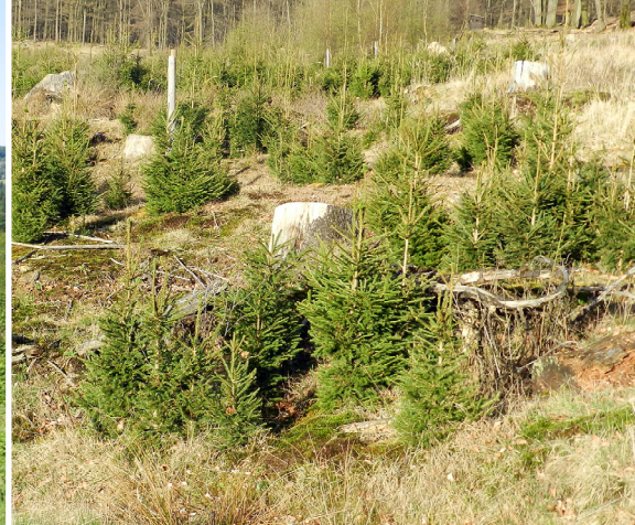
3 – Kyrillflächen neun Jahre nach dem Orkan.