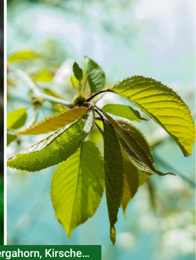
Bevorzugt vom Rehwild: Bergahorn, Kirsche...