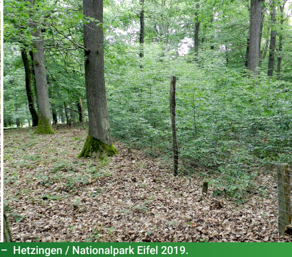
5 – Königsforst im Mai 2017. | 6 – Hetzingen / Nationalpark Eifel 2019.