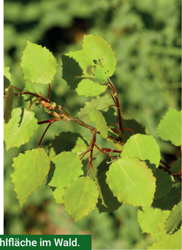
Ebereschen, Weiden und Aspen besiedeln jede Kahlfläche im Wald.

Dabei wäre milder Humus notwendig, um Wasser zu speichern. Das Fehlen von Ebereschen, Salweiden und Aspen auf den Flächen hat noch weitere negative Auswirkungen auf die Wiederbewaldung. Wichtige Funktion dieser Vorwaldarten sind neben der Bodenverbesserung der Schutz des Bodens und der nachwachsenden Bäumchen vor Spätfrösten und Hitze. Die „Hauptbaumarten“ – im Sinne eines künftigen, klimastabilen Waldes – können sich oft erst im Schutz dieser Vorwaldbäumchen etablieren.