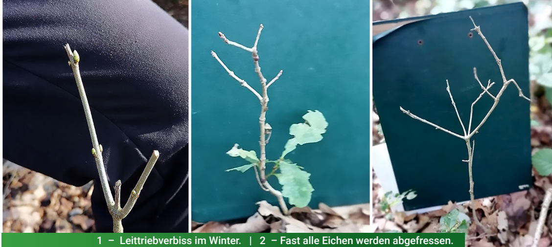
1 – Leittriebverbiss im Winter. | 2 – Fast alle Eichen werden abgefressen.