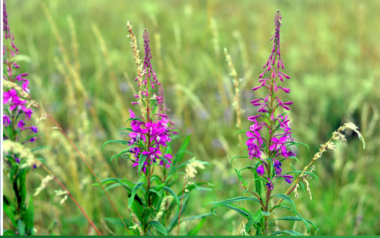
...und Eiche. Auch das Schmalblättrige Weidenröschen äst das Reh gern.

Neben den materiellen Schäden verursacht massiver Verbiss auch ökologische Folgeschäden. Durch die Überweidung wachsen am Waldboden oft nur ökologisch wenig wertvolle Allerwelts-Gräser. Seltene und in ihrem Bestand gefährdete krautige Arten werden dagegen selektiert, das heißt, es findet eine Verschiebung des Artenspektrums statt. Wichtige Waldarten wie das Schmalblättrige Weidenröschen werden fast komplett von den Rehen gefressen. Eigentlich würde sich diese Art auf Kahlfleichen rasch massenhaft ausbreiten. Aufgrund des Fraßdruckes kommen außerhalb von rehdichten Gattern keine Weidenröschen zur Blüte. Damit fällt diese Art als Wirtspflanze für Waldinsekten aus.