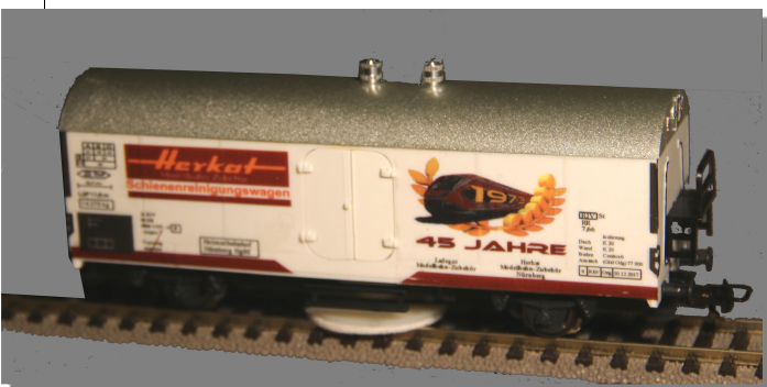
1309 Schienenreinigungswagen-Set , „45 Jahre Herkat Schienenreinigungs-Wagen“ mit rotierender Reinigungsscheibe, wahlweise zum Naß- oder Trockenreinigen, nur durch Auswechseln der beiliegenden Reinigungsscheiben. Zwei bewegliche Doppeltüren, dahinter der transparente Reinigungsmittel-Tank., dadurch leichte Kontrolle der Reinigungsmittelmenge (bei Naßreinigung). Mit je zwei Ersatz-Reinigungsscheiben. Für alle HO 2-Leiter-Gleise. Mit je einer Haken- und Bügelkupplung. LÜP 137 mm. 1359 Schienenreinigungswagen - Set dto, jedoch für PUKO - Gleise, mit 2 Bügelkupplungen

Für jede Art von verschmutzten Gleisen: Die Naßreinigung: Zum Reinigen der Schienen mittels Filzschleifer, vorzugsweise bei fettigem Schmutz. Zum Füllen mit unserem Schienenreinigungsmittel SR 24. Mit Füllstandsanzeige hinter den zu öffnenden Doppeltüren. Über die Regulierverschraubung läßt sich das Reinigungsmittel genau dosieren. Die Trockenreinigung: Zum Reinigen der Schienen mittels Clean-o-fix Scheibe, vorzugsweise trockenem Schmutz (korrodierten Schienen). Die Wagen 1301/02 und 1351/52 lassen sich durch Austauschen des Reinigungsschleifers auch zur Trockenreinigung einsetzen.