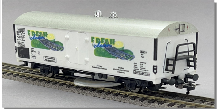
1305 Schienenreinigungswagen mit rotierender Reinigungsscheibe. Zum Füllen mit SR 24. Auf dem Dach je eine Einfüll- und Regulierverschraubung. Zwei bewegliche Doppeltüren, dahinter der transparente Reinigungsmittel-Tank., dadurch leichte Kontrolle der Reinigungsmittelmenge. Vorbildgerechte Beschriftung. Für alle HO 2-Leiter-Gleise. Mit je einer Bügel- und Haken-Kupplung. LÜP 137 mm 1355 Schienenreinigungswagen dto, jedoch für PUKO - Gleise, mit 2 Bügelkupplungen.

Die Herkat- Schienenreinigungswagen halten die Gleise in der wertvollen Modellbahnanlage immer tadellos sauber. Durch Zusammenwirken von unserem Schienenreinigungsmittel SR 24 und der rotierenden Reinigungsscheibe wird eine hervorragende Reinigungswirkung erzielt.