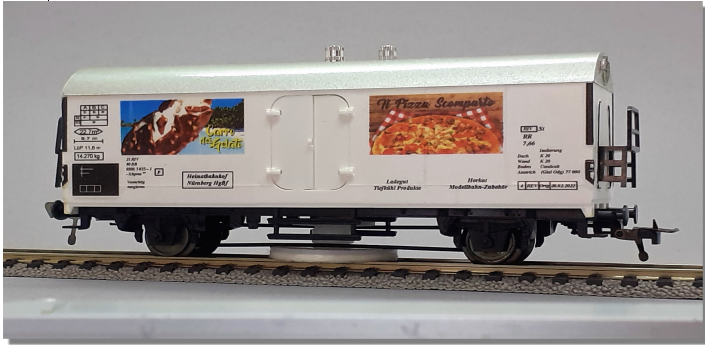
1303 Schienenreinigungswagen „Tiefkühlkost“ mit rotierender Reinigungsscheibe. Zum Füllen mit SR 24. Auf dem Dach je eine Einfüll- und Regulierverschraubung. Zwei bewegliche Doppeltüren, dahinter der transparente Reinigungsmittel-Tank., dadurch leichte Kontrolle der Reinigungsmittelmenge. Vorbildgerechte Beschriftung. Für alle HO 2-Leiter-Gleise. Mit je einer Bügel- und Haken-Kupplung. LÜP 137 mm 1353 Schienenreinigungswagen dto, jedoch für PUKO - Gleise, mit 2 Bügelkupplungen.

Die Herkat- Schienenreinigungswagen halten die Gleise in der wertvollen Modellbahnanlage immer tadellos sauber. Durch Zusammenwirken von unserem Schienenreinigungsmittel SR 24 und der rotierenden Reinigungsscheibe wird eine hervorragende Reinigungswirkung erzielt.