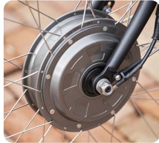
VR1F Motor des Silent Elektrosystems