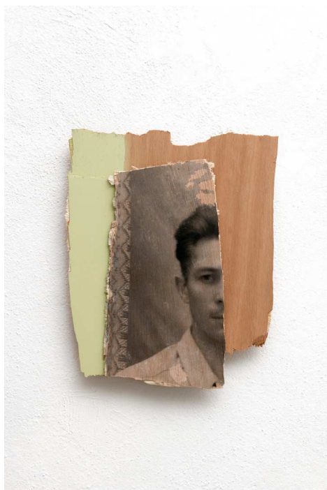
Isabelle Ferreira L'invention du courage (O salto), SAF

2021, acrylique sur bois, 24,5 x 31 x 3 cm. Collection FRAC Poitou-Charentes.