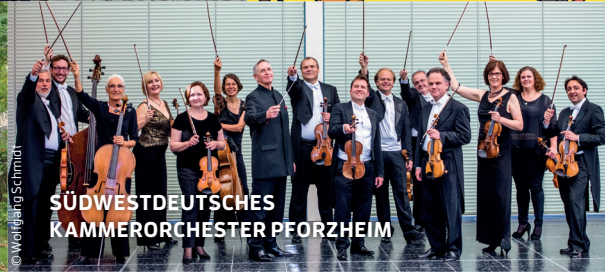
SÜDWESTDEUTSCHES KAMMERORCHESTER PFORZHEIM