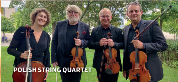
POLISH STRING QUARTET