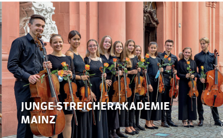
JUNGE STREICHERAKADEMIE MAINZ