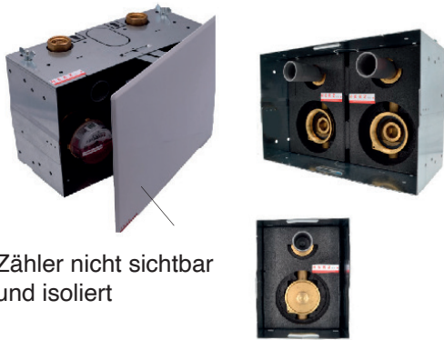
Zähler nicht sichtbar und isoliert

Messbox mit wasserführenden Teilen aus hochwertigem Rotguss oder trinkwasserbeständigem Messing als Duo- oder Mono-System für 1 oder 2 Wasserzähler. Die Universal-Messkapsel Koax 2" (Hamburger Modell) oder das bekannte Allmess Zählersystem (M77 x 1,5) ist im Montagegehäuse mit Isolierschale sicher und fest verankert. Die Messbox ist mit Stahlblechgehäuseschalen und 4 Universalwinkeln versehen und eignet sich für die Montage im Mauerwerk sowie in Trockenbausystemen. Schall- und wärmedämmt, vormontiert und auf Dichtheit geprüft.