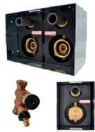
Bleifreies Rotguss DVGW