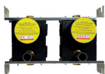
Bleifreies Rotguss DVGW