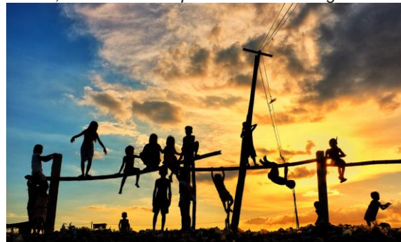
Gewinnerfoto Rotary International 2022

Das nachfolgende Foto, das wir vor Ort gemacht haben, wurde von RI auf den Platz 1 gewählt mit der Begründung: Die verspielten, organischen Formen der Kinderkörper bilden einen starken Kontrast zu den harten Linien der Strommasten und -leitungen. Trotz der begrenzten Farbpalette des Fotos hat man das Gefühl, dass es eine Explosion von Farben gibt.