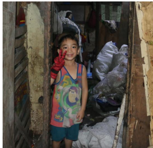
Der Junge sortiert den Müll, um ihn zu verkaufen.

Die Kinder sind gezwungen, ihren Unterhalt zu verdienen, wir bieten Ihnen einen sauberen und sicheren Ort (Vorschule), Nahrung und Bildung. Nur so können die Kinder in eine bessere Zukunft starten. Diese Kinder brauchen unsere/Ihre Hilfe!