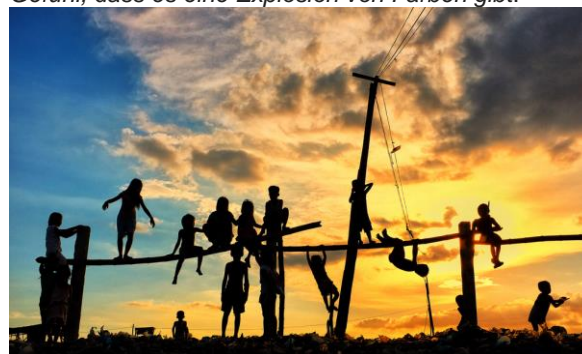
Gewinnerfoto Rotary International 2022, Heft 7, Seite 6

Das nachfolgende Foto, das wir vor Ort gemacht haben, wurde von RI auf den Platz 1 gewählt mit der Begründung: Die verspielten, organischen Formen der Kinderkörper bilden einen starken Kontrast zu den harten Linien der Strommasten und -leitungen. Trotz der begrenzten Farbpalette des Fotos hat man das Gefühl, dass es eine Explosion von Farben gibt.