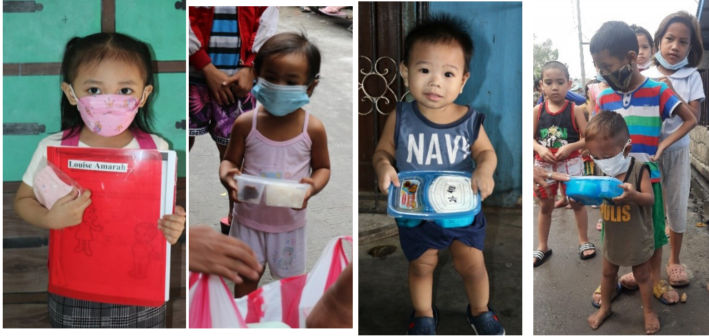
Die Mahlzeiten mussten während des Lockdowns an die Kinder der Vorschule verteilt werden, ebenso die Lernmaterialien.