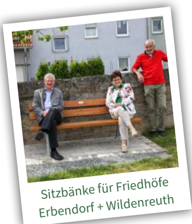
Sitzbänke für Friedhöfe Erbendorf + Wildenreuth