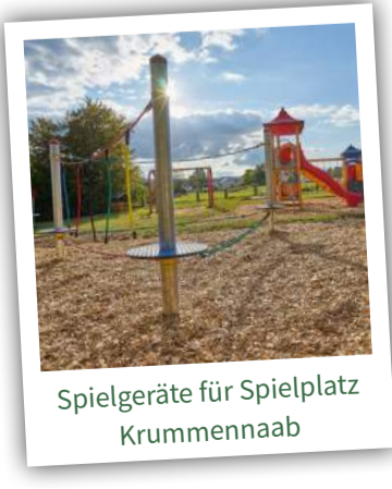
Spielgeräte für Spielplatz Krummennaab