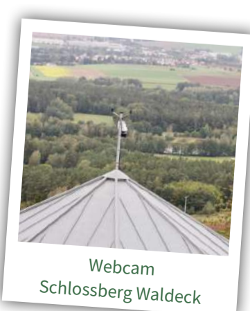
Webcam Schlossberg Waldeck