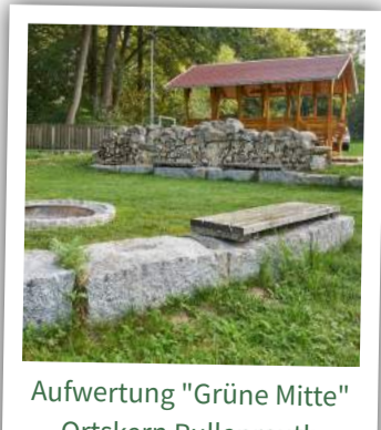
Aufwertung "Grüne Mitte" Ortskern Pullenreuth