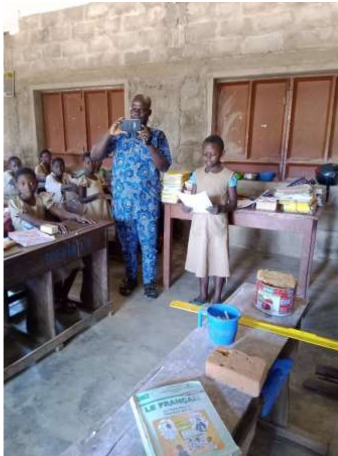
Discours de remerciement lu par une élève de CM2