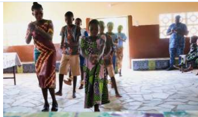
Spectacle des enfants et des mamans