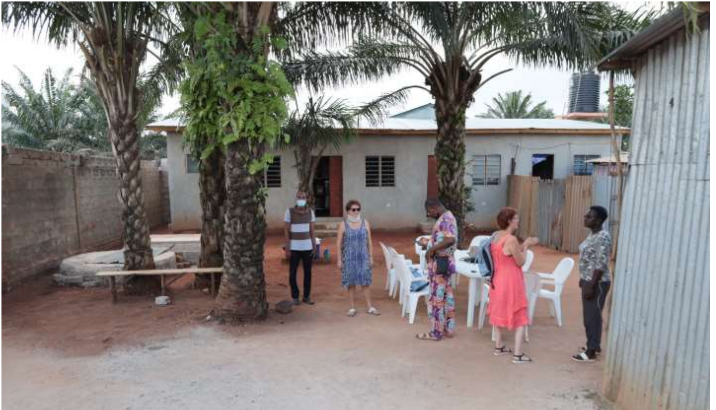
Nouveau bâtiment en dur permettant une meilleure conservation des livres