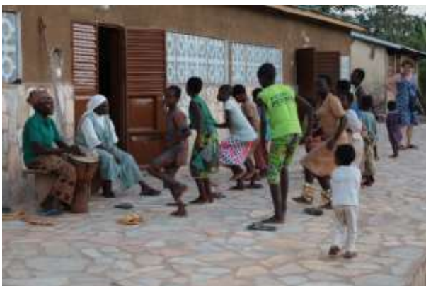
Répétition des danses

Le 20 novembre, en présence des autorités locales, chef d'arrondissement, chef de brigade, curé de la paroisse, ancien préfet de l'Atakora, de l'équipe Jar'Nati présente au Bénin, des sœurs et des membres de la communauté de la Cité de la Joie, l'inauguration eut lieu dans une ambiance festive.