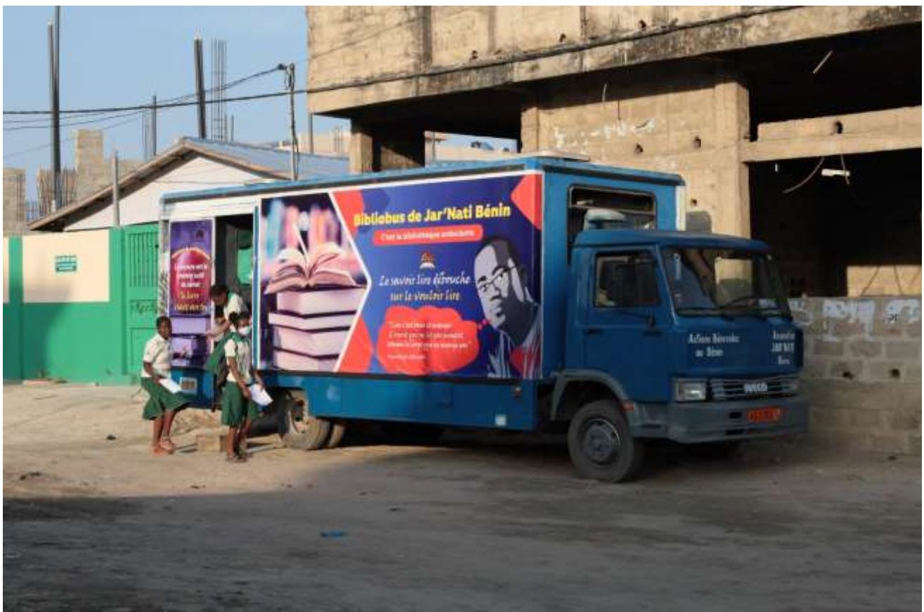
Le bibliobus garé près du collège privé Saint Laurent, dans le quartier Akpakpa à Cotonou