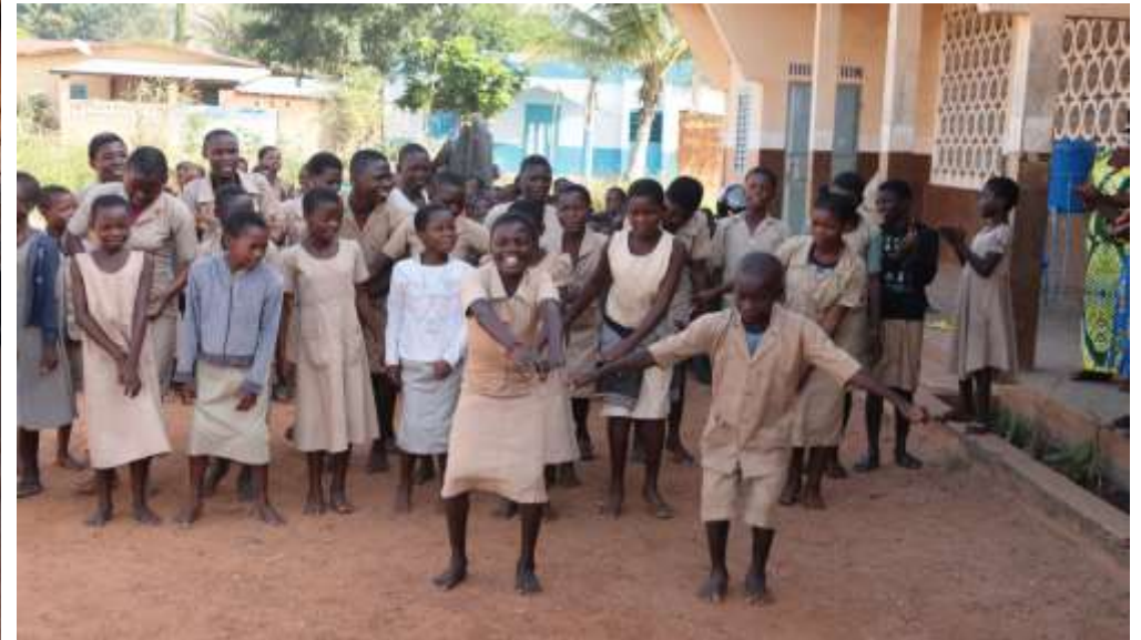
Accueil des élèves ayant reçu l'aide scolaire de Jar'Nati