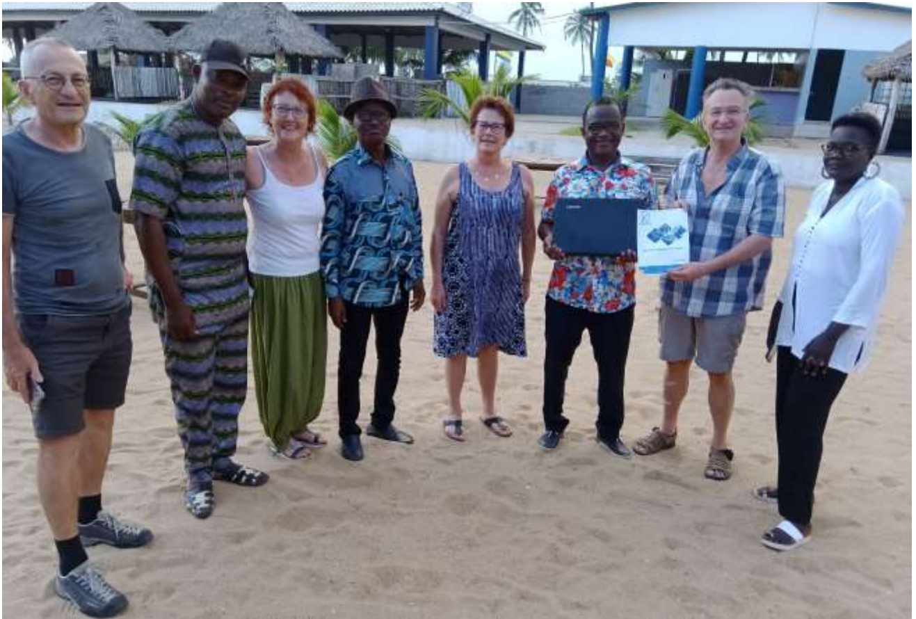
Remise du premier PC portable offert par la société BECS