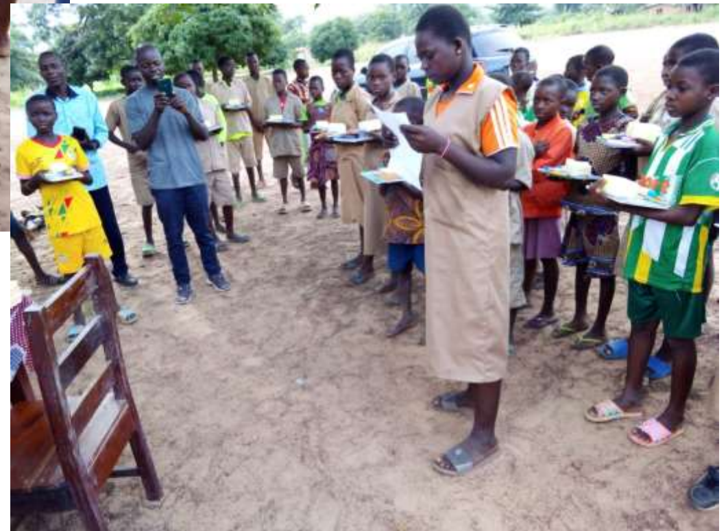
Elève de CM1 faisant une allocution de remerciement