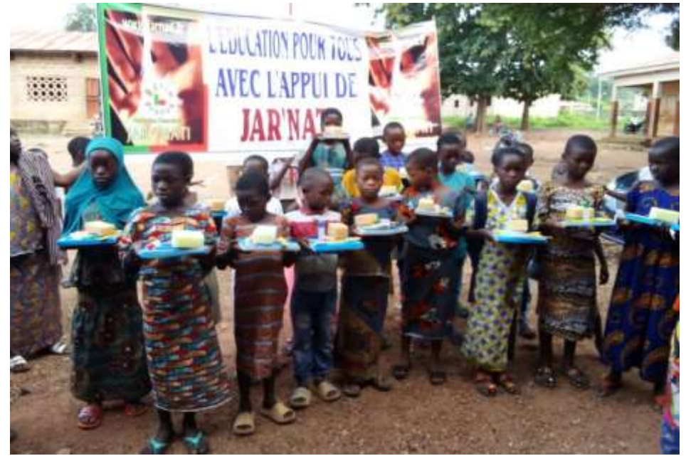
Elèves de CE2