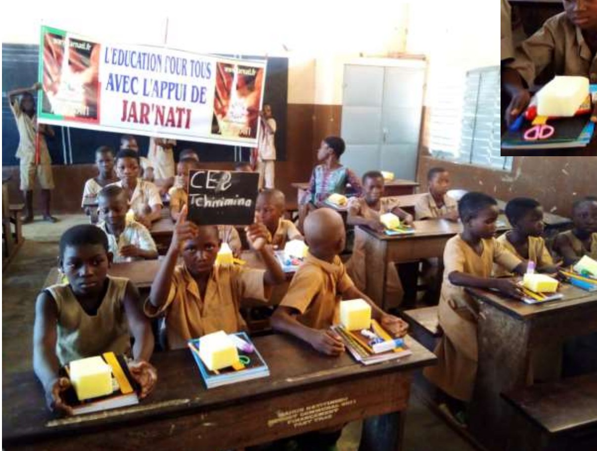
Elèves de CE2