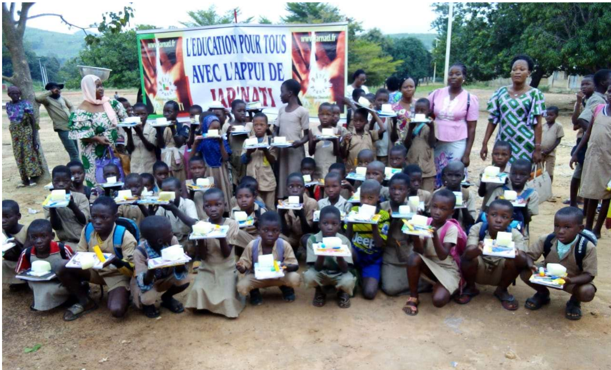
Les élèves bénéficiaires dans la cour de l'école de Boriouré (groupe D) avec leur directrice et des enseignantes