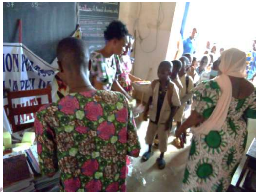
Remise des kits scolaires