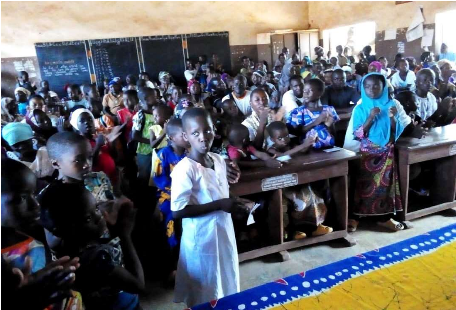
Une assemblée de parents et d'élèves attentive