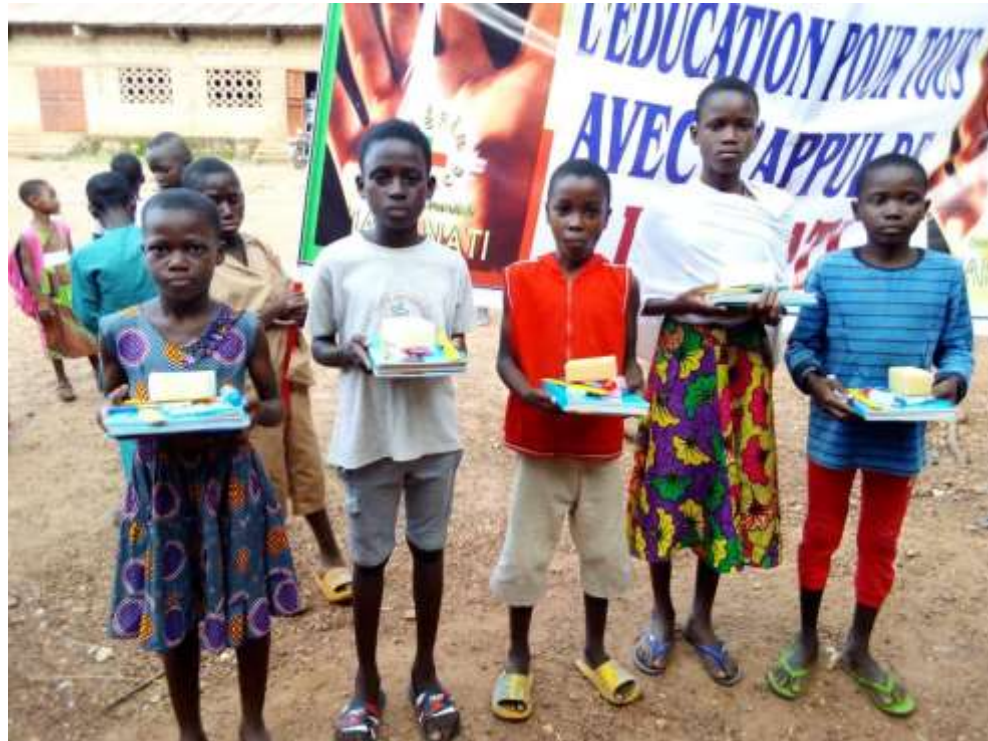
Elèves de CM1