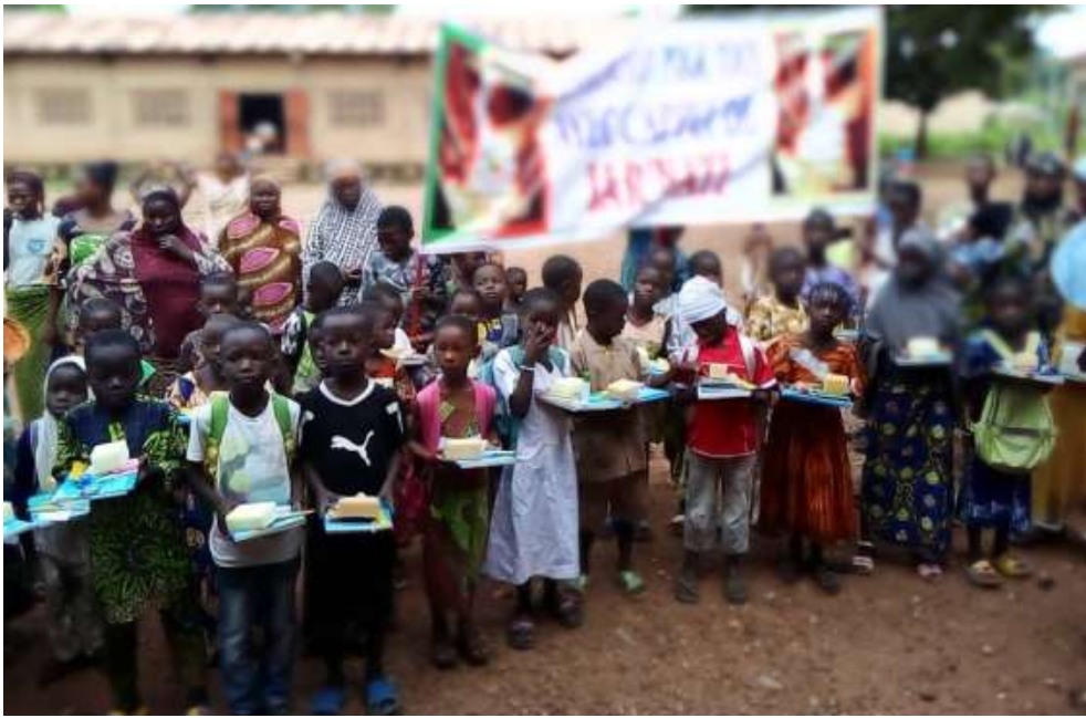
Elèves de CE1