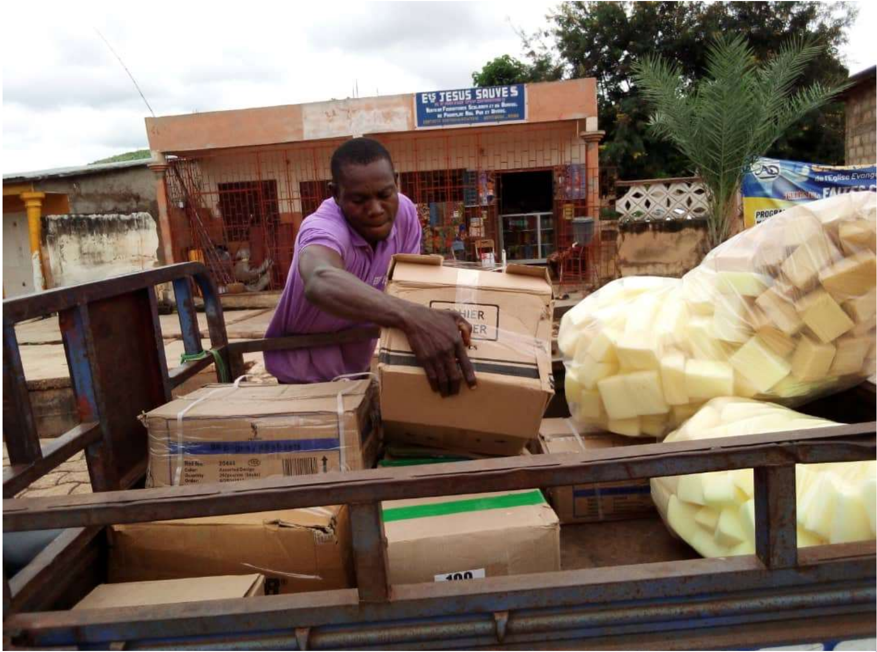
Les fournitures scolaires sont prêtes à être livrées