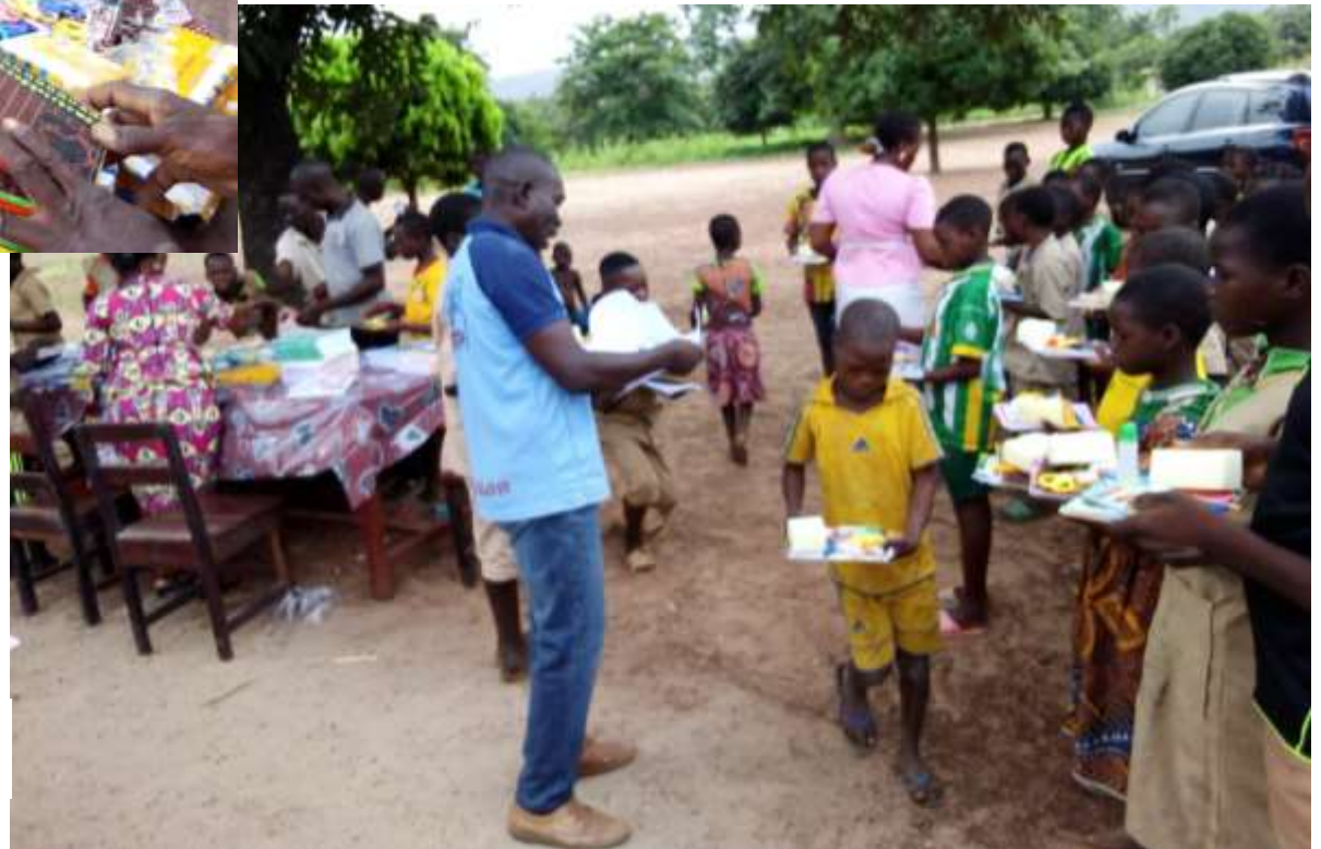
Distribution par le directeur de l'école