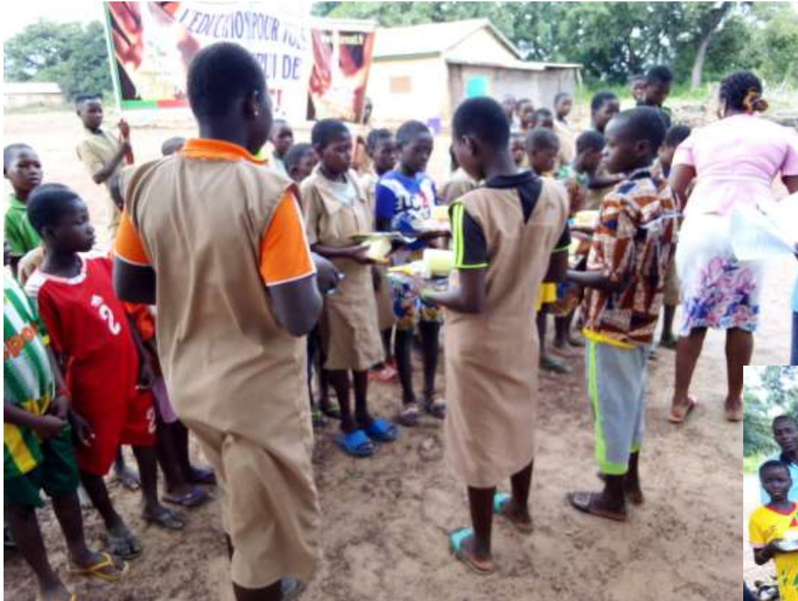
Elèves ayant reçu leur kit