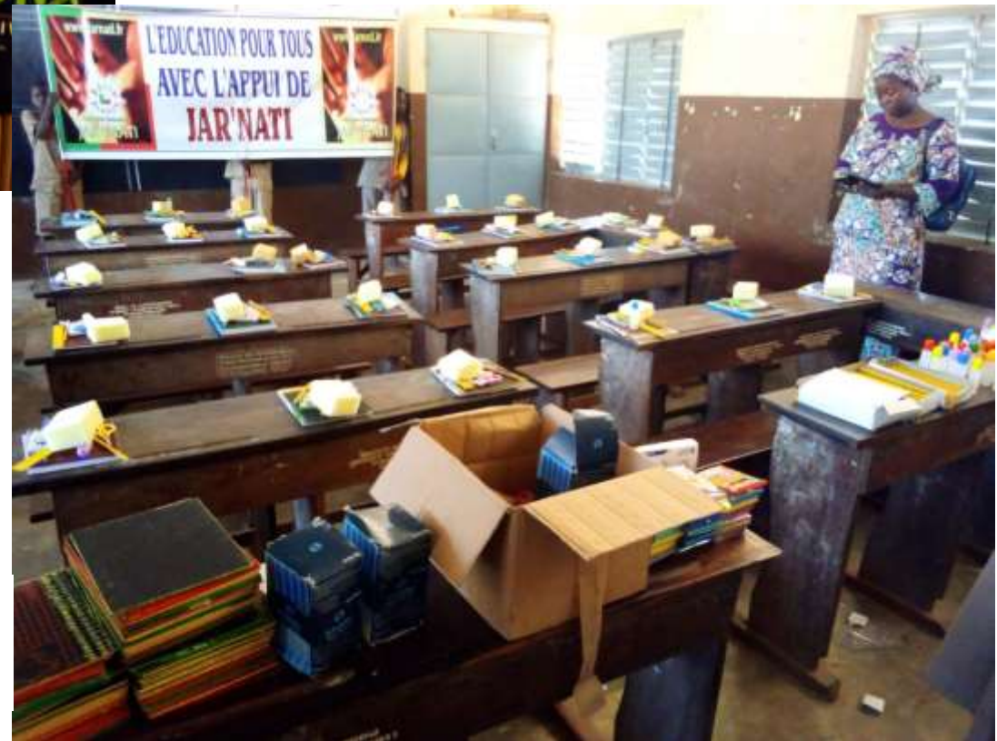
Les kits sont prêts