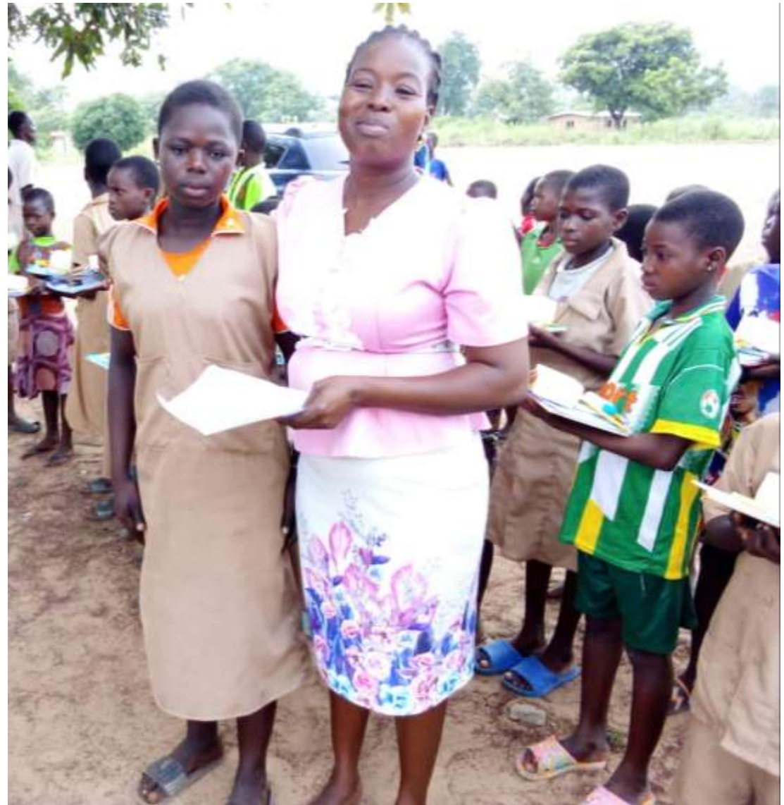
Ecolière de CM 1 et Constante