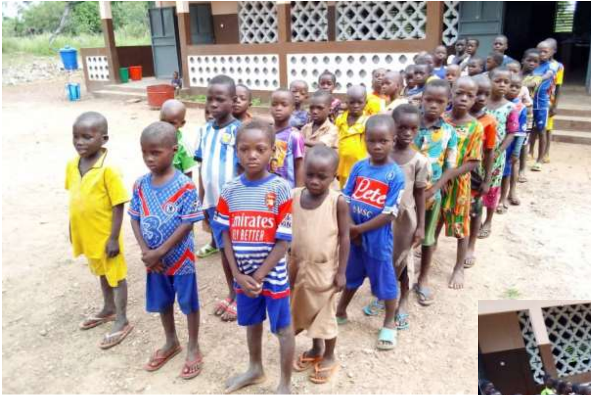
Les élèves bénéficiaires dans la cour de l'école de Koubirigou