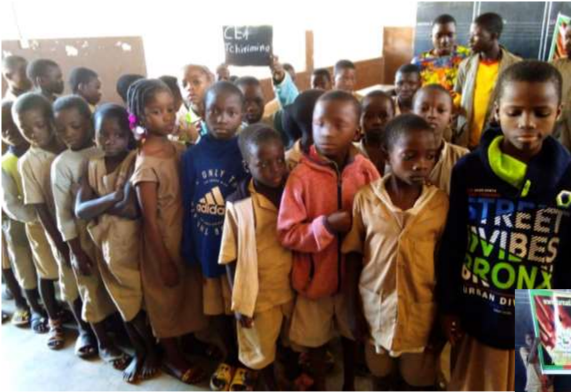
Ils attendent leur tour