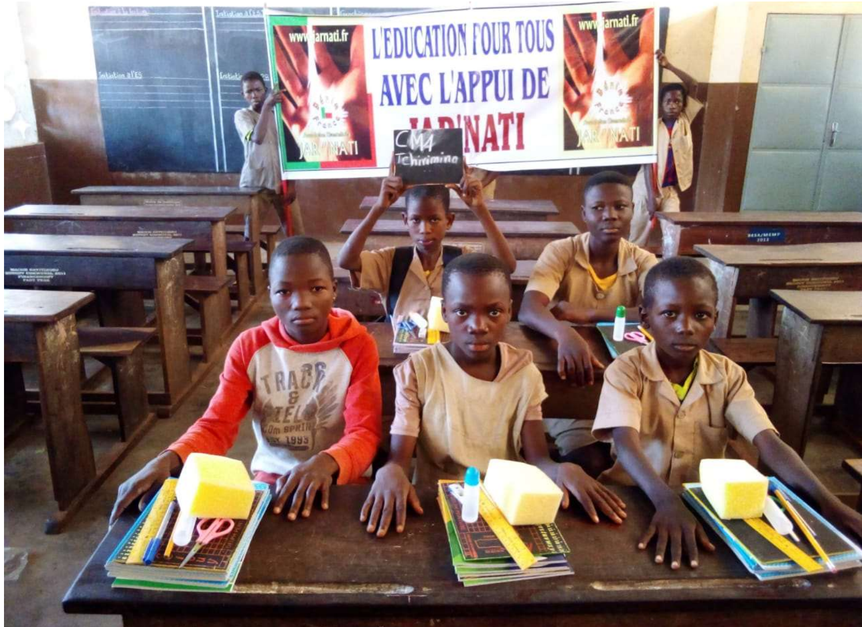
Elèves de CM1