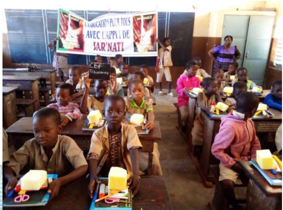
Elèves de CE1