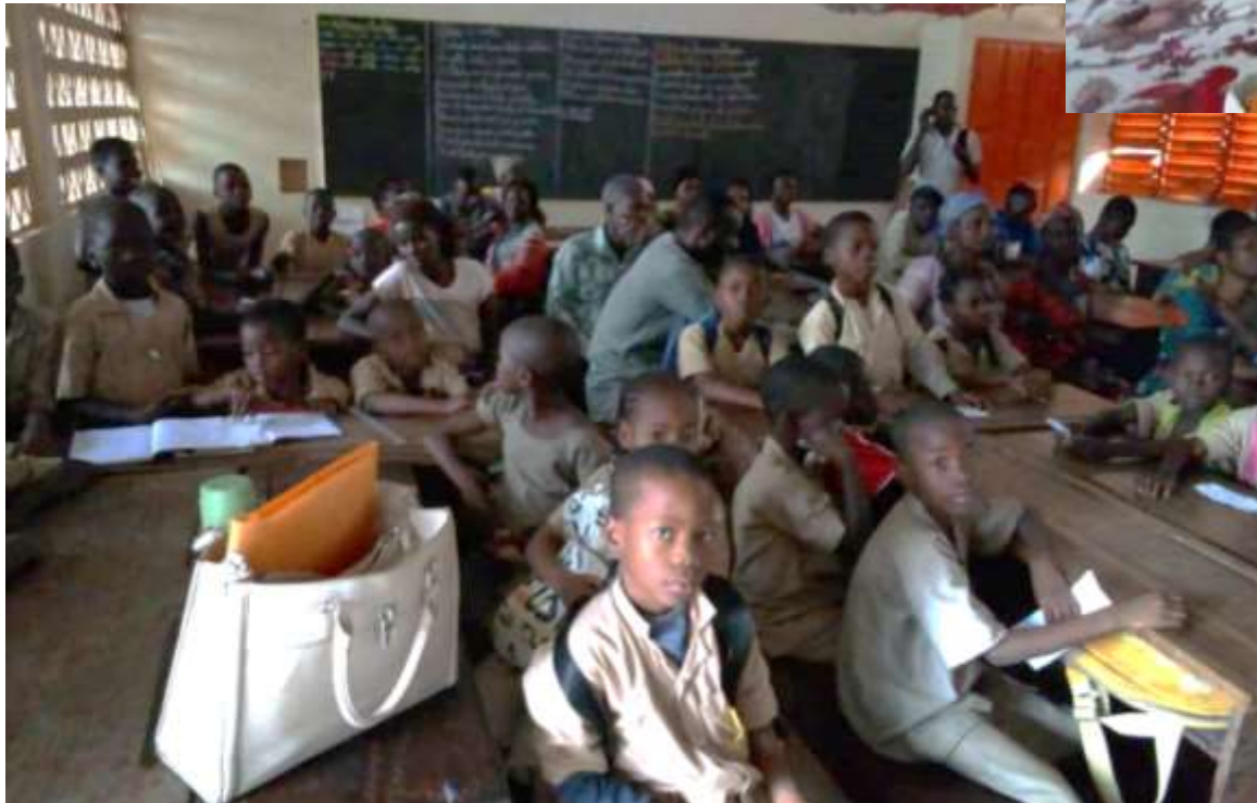
Assemblée d'élèves et de parents attentifs