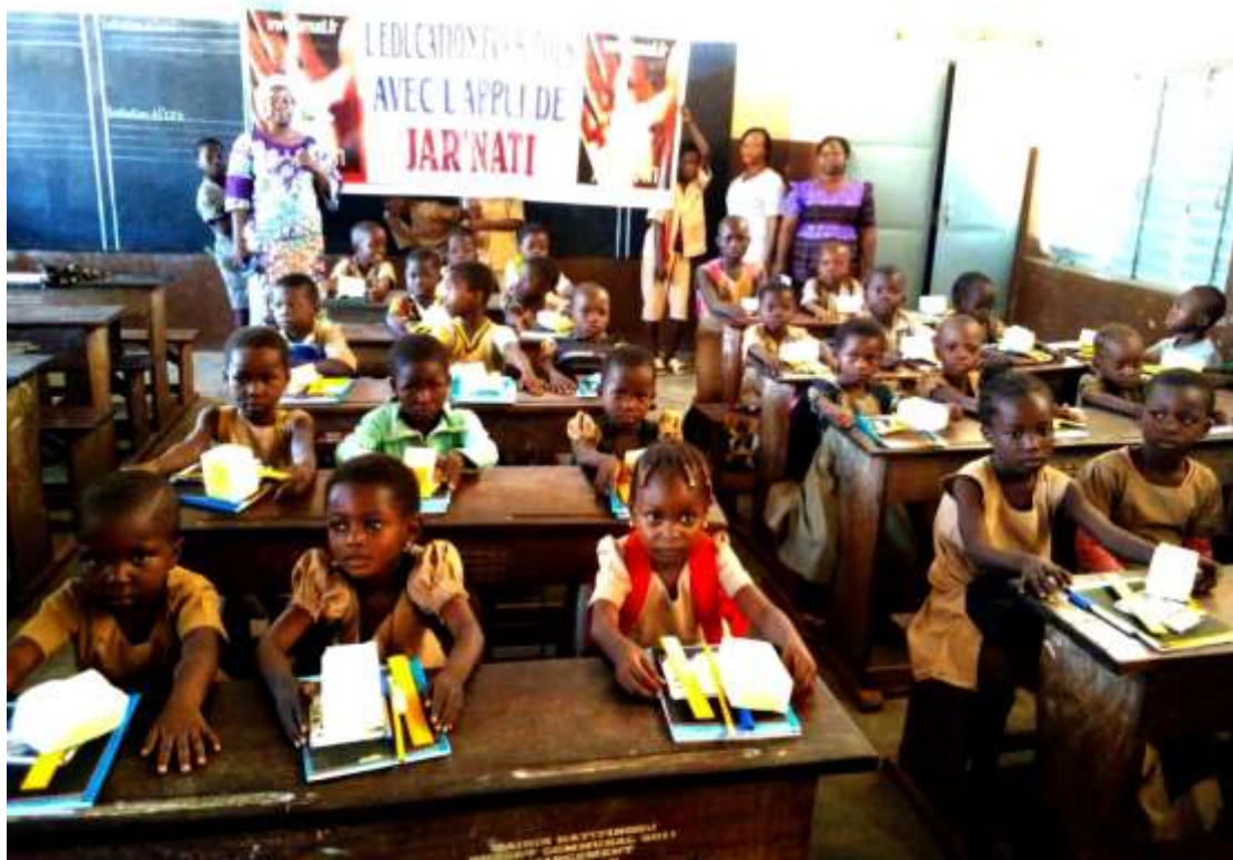
Elèves de CI