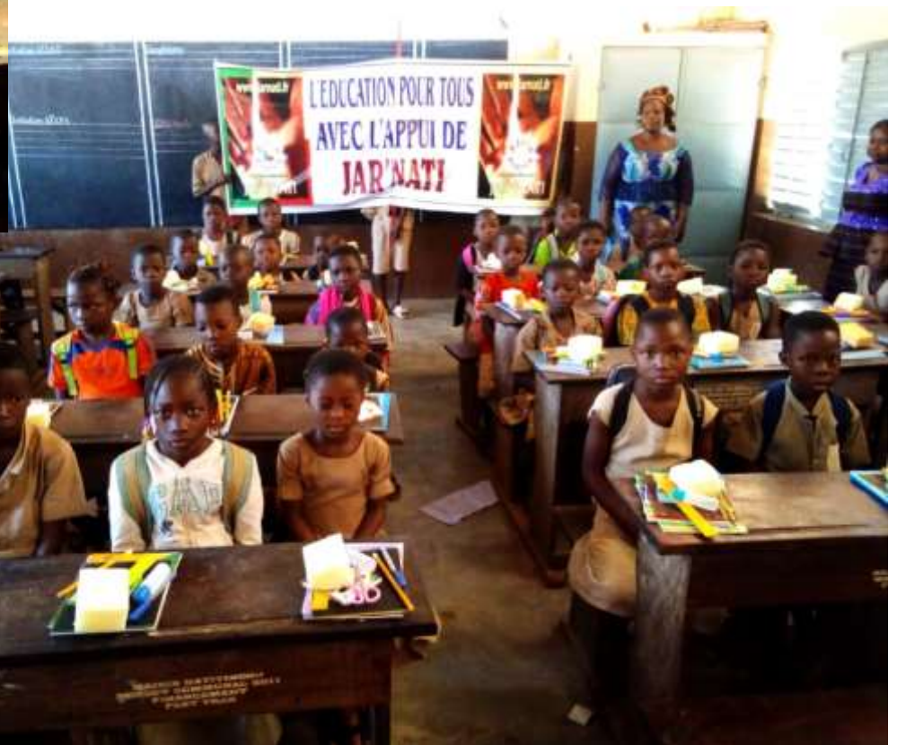
Elèves de CP