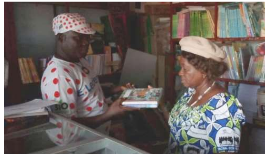
Achat des fournitures chez "Jésus Sauve"