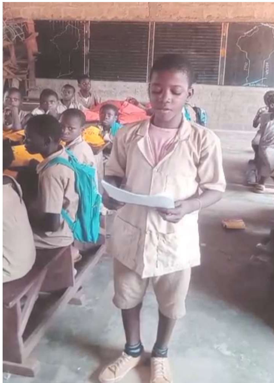
Remerciements à Jar'Nati