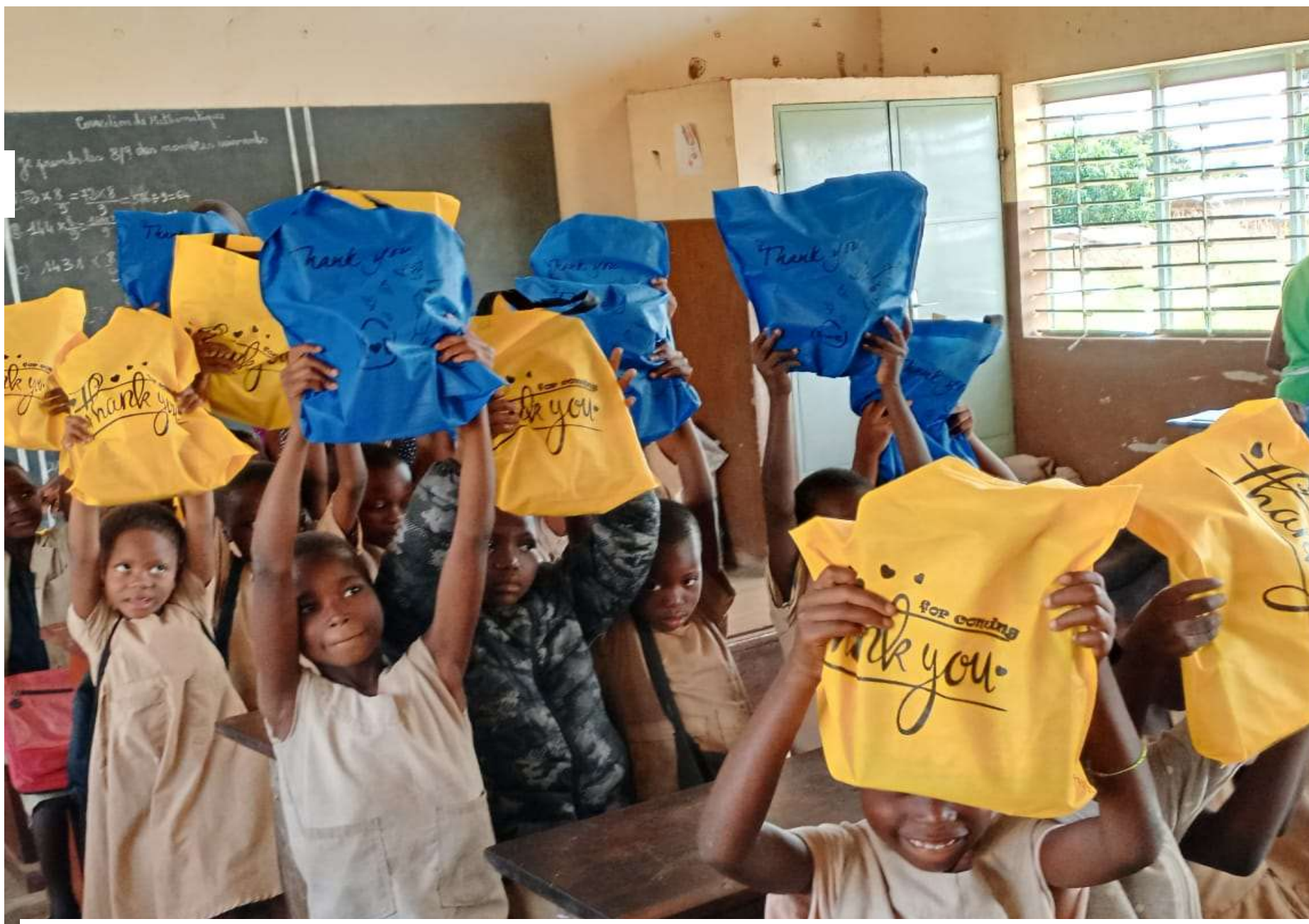
Joie des élèves bénéficiaires