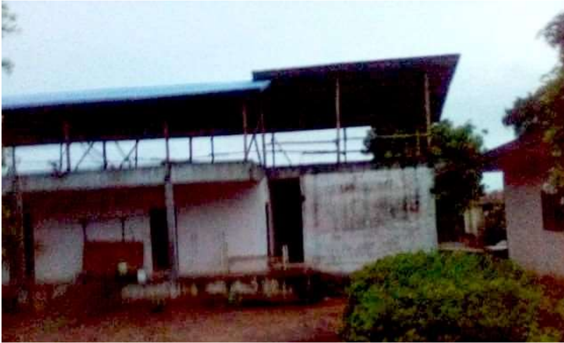
Toiture assurant l'étanchéité du bâtiment dortoir

Bâtiment dortoir inutilisé à cause des infiltrations d'eau dues à un toit terrasse défectueux. Les 24 pensionnaires sont hébergés dans 4 chambres à raison de 6 personnes par chambre. En avril, la mise en étanchéité du bâtiment comportant cinq chambres a été effectuée par la pose d'une toiture additionnelle.