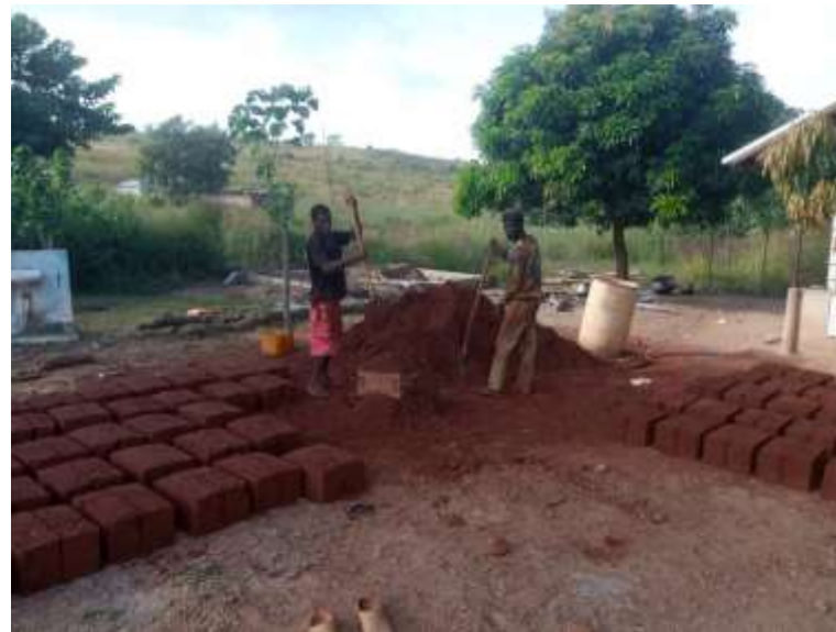
fabrication des parpaings