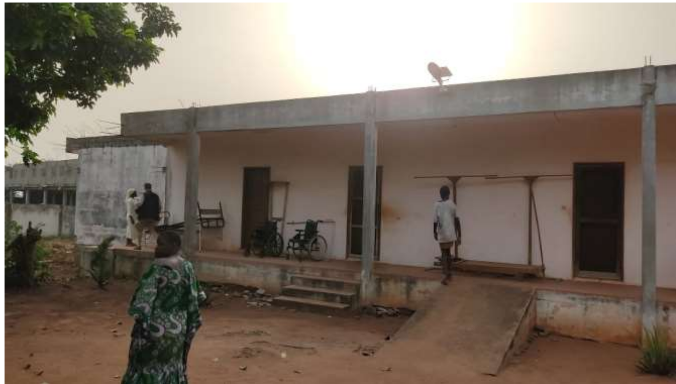
Dortoir de 5 chambres, exposé à des infiltrations d'eau par le toit. Janvier 2023

'Vidjingni' : « Il est aussi un enfant à aimer. »