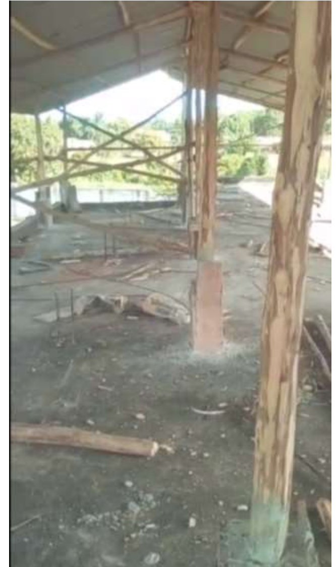
Terrasse couverte à aménager

C'est un des projets majeurs de Jar'Nati pour l'année 2024.