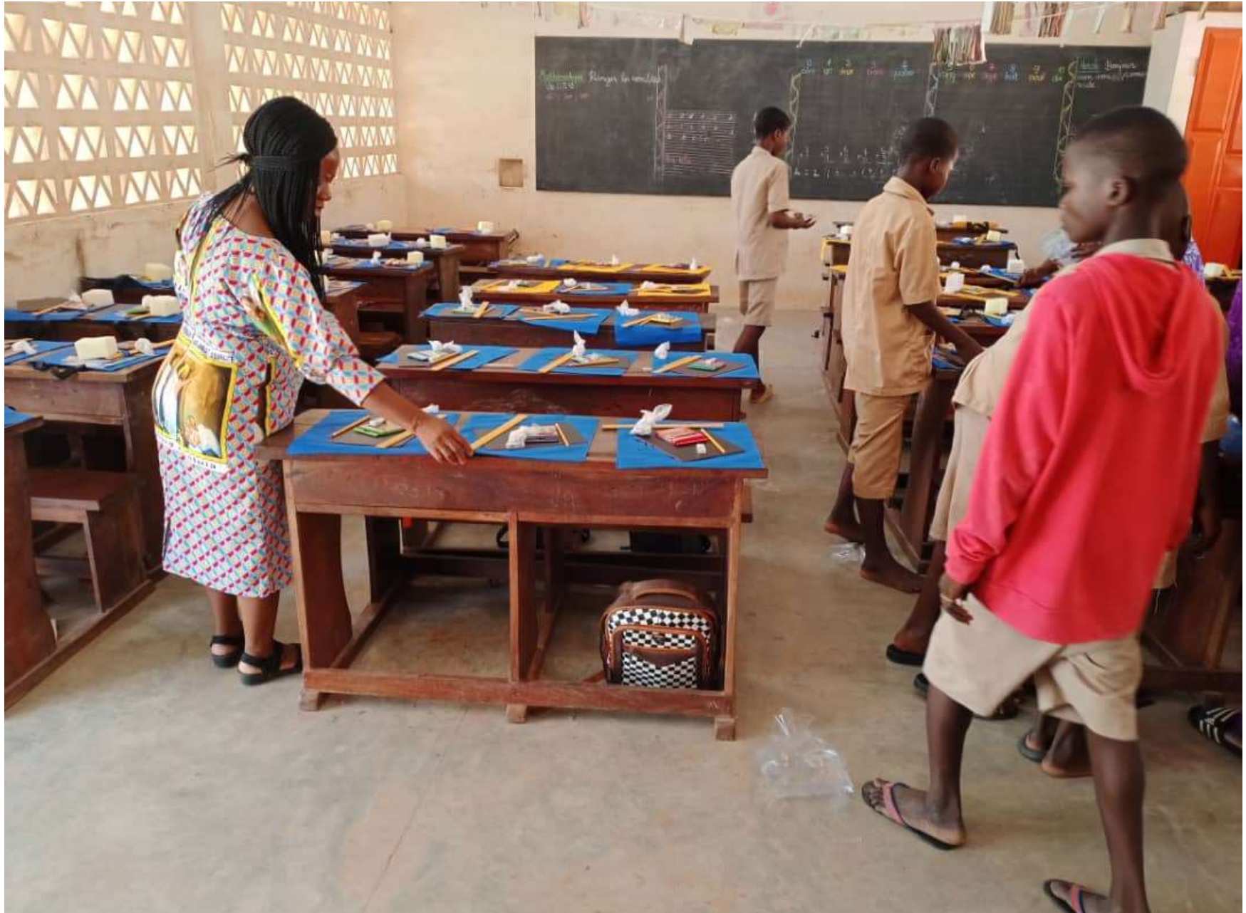
Préparation des kits scolaires