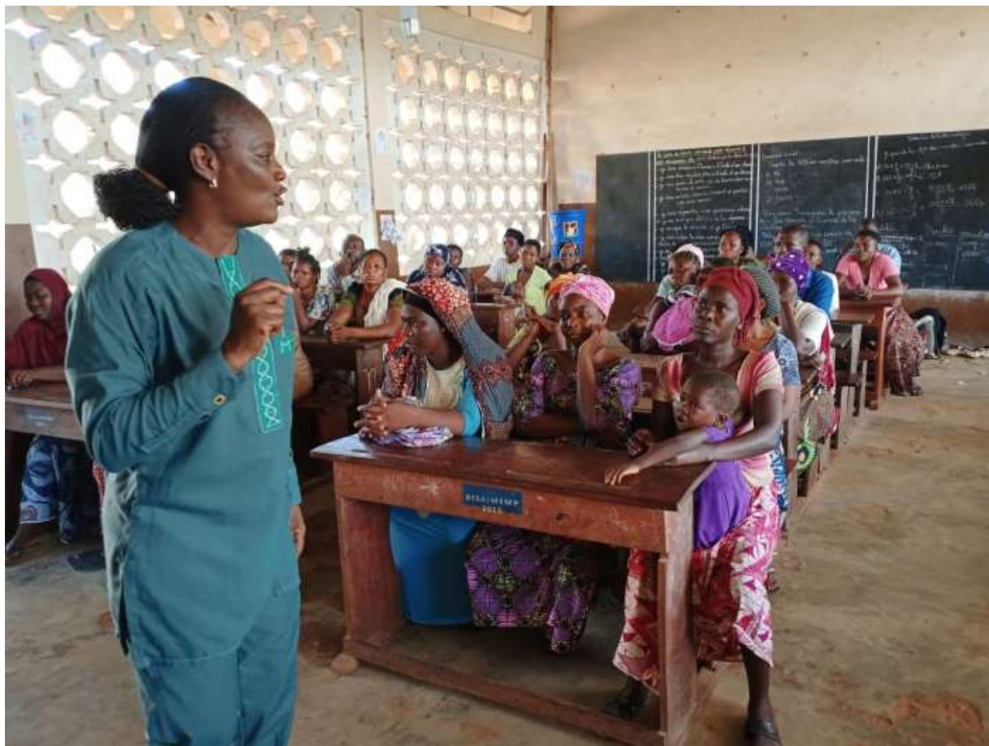
La directrice et des parents d'élèves bénéficiaires des kits scolaires