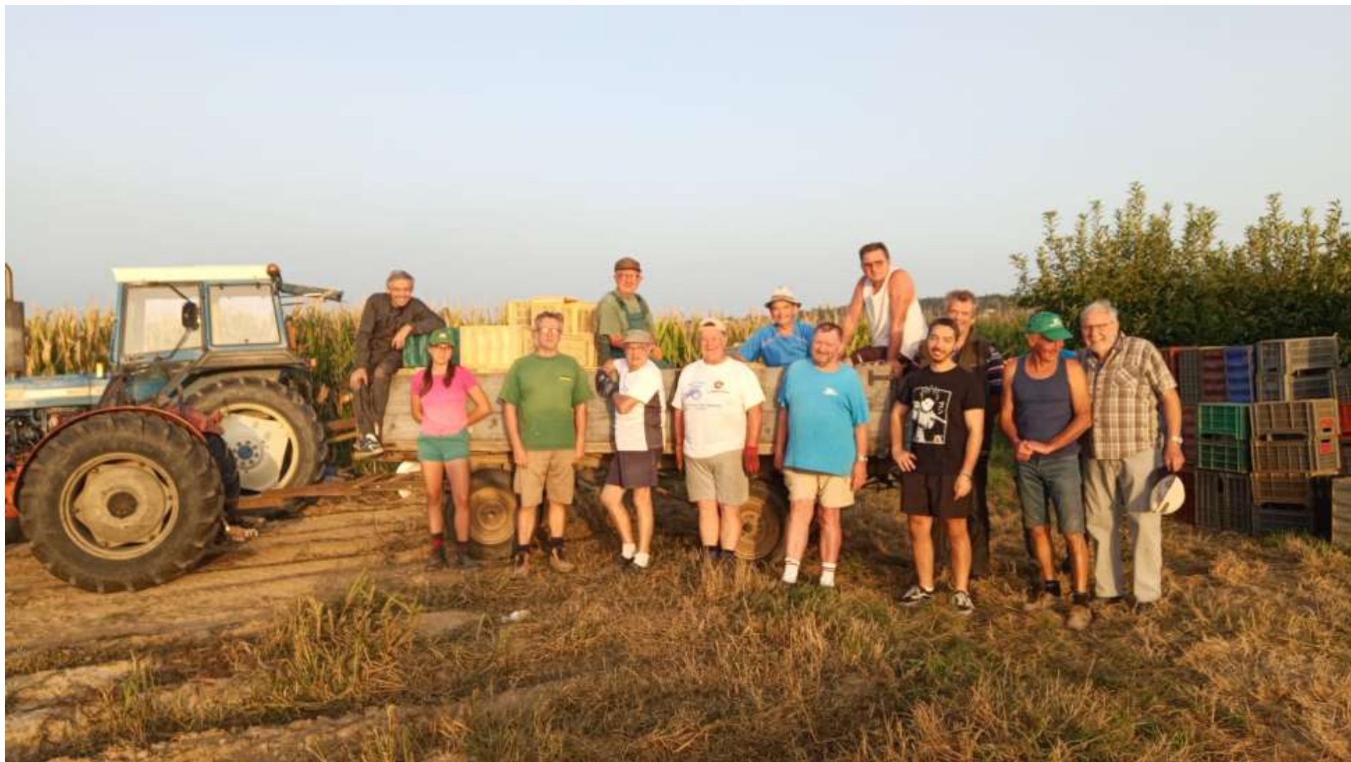
Une partie de l'équipe de bénévoles

Campagne 2023 : plus de 360 sacs de 20 kg vendus.