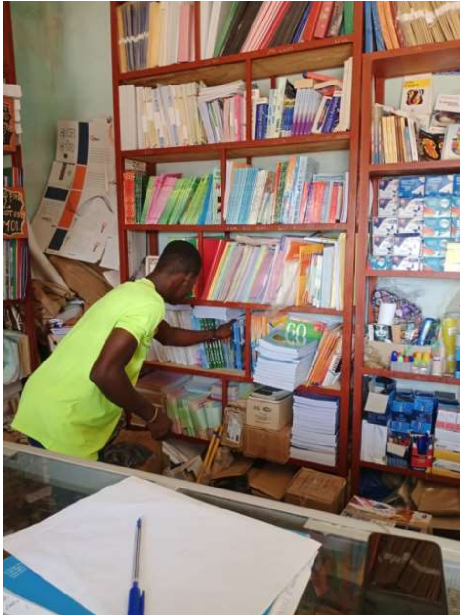
Choix des fournitures