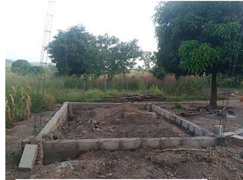
Réalisation des fondations