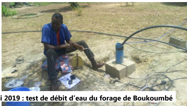
Mai 2019 : test de débit d'eau du forage de Boukoubé

Pour chaque orphelinat : Forage d'un puits, réalisation d'un château d'eau en béton de 12m 3 de contenance et de 10m de hauteur. Equipement du puits avec une pompe solaire et mise en place d'un réseau de distribution sous forme de bornes fontaines.