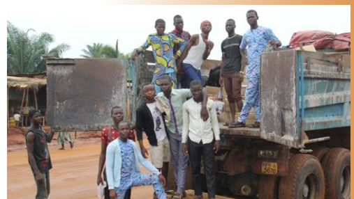
Une équipe de jeunes bénévoles béninois qui aide à un chargement de Dons à Cotonou.