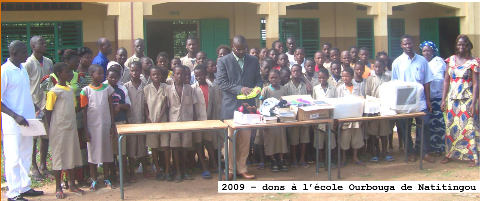
2009 - dons à l'école Ourbouga de Natitingou