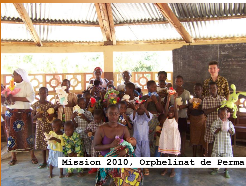
Mission 2010, Orphelinat de Perma