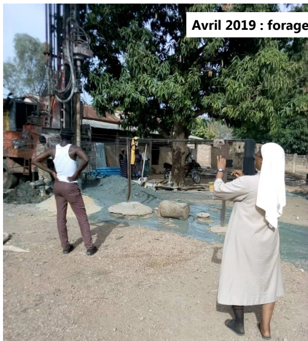
Avril 2019 : forage du Puits de Boukoubé. Celui de Perma a été foré en Avril 2018

Depuis bientôt 10 ans, Jar'Nati soutient les orphelinats de Perma et Boukoubé par l'apport de dons en nature (vêtements, jouets, lait infantile etc...). La mission 2017 a étudié de près les difficultés des deux établissements et a conclu à ce constat : Beaucoup de problèmes seraient allégés si l'accès à l'eau potable était garanti toute l'année.