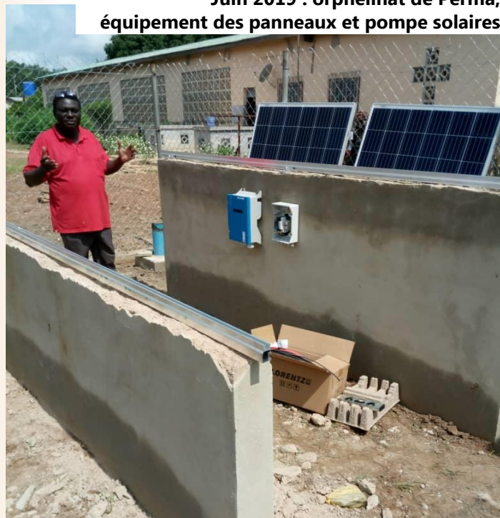
Juin 2019 : orphelinat de Perma, équipé des panneaux et pompe solaires