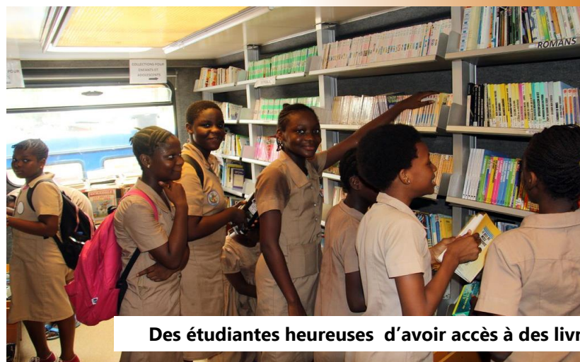
Des étudiantes heureuses d'avoir accès à des livres