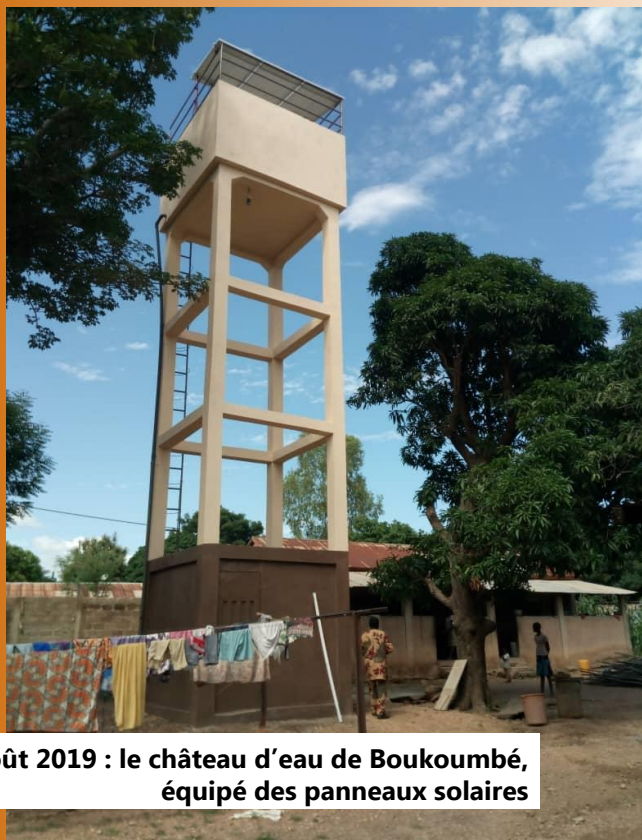
Août 2019 : le château d'eau de Boukoumbé, équipé des panneaux solaires