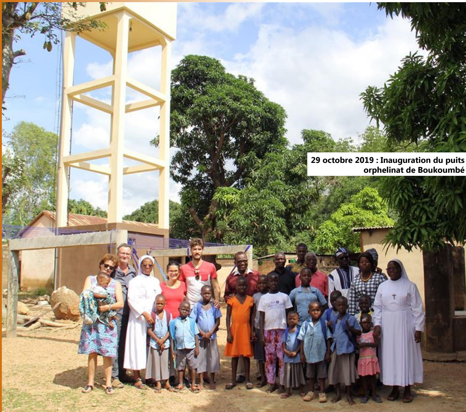
29 octobre 2019 : Inauguration du puits orphelinat de Boukoumbé