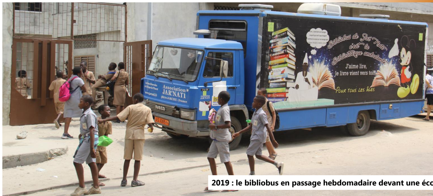
2019 : le bibliobus en passage hebdomadaire devant une école