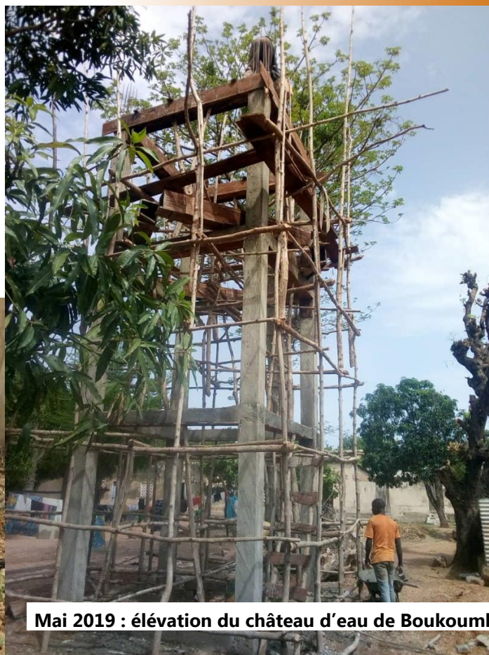
Mai 2019 : élévation du château d'eau de Boukoubé