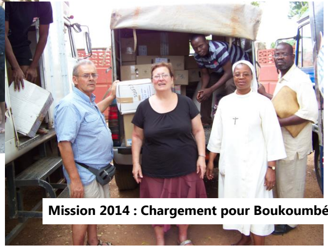
Mission 2014 : Chargement pour Boukoubé

Nous maîtrisons la logistique maritime et la sortie de nos containers du port de Cotonou grâce à Jar'Nati Bénin. A ce jour, nous avons affrété 6 containers.