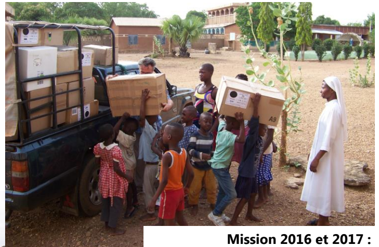
Mission 2016 et 2017 : Dons orphelinat de Boukoubé