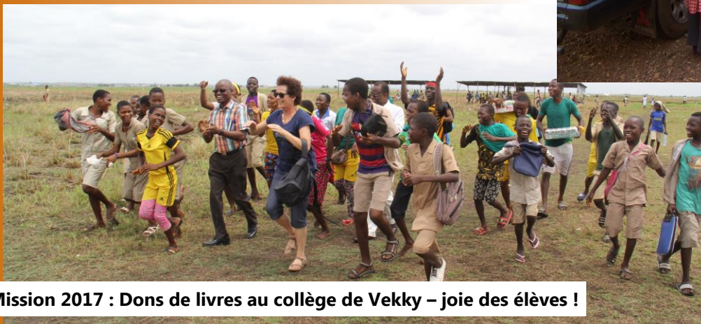
Mission 2017 : Dons de livres au collège de Vekky – joie des élèves !