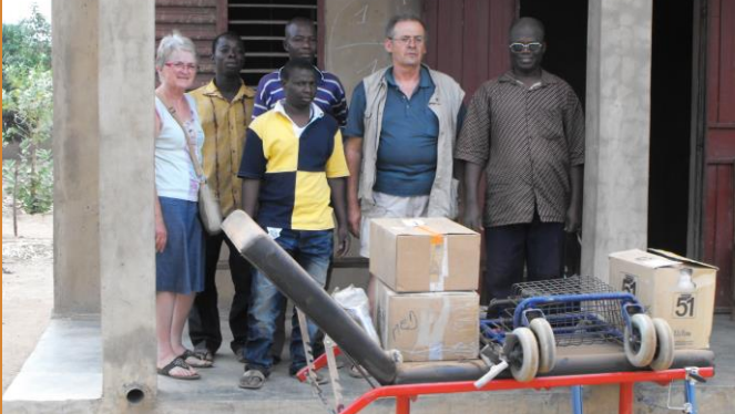
Mission 2012 : Dons dispensaire de Guilmaro