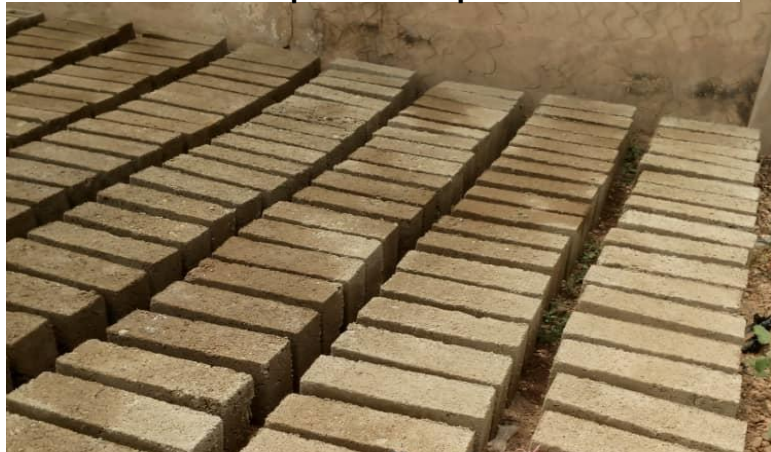
Mai 2019 : fabrication sur place des briques du château d'eau