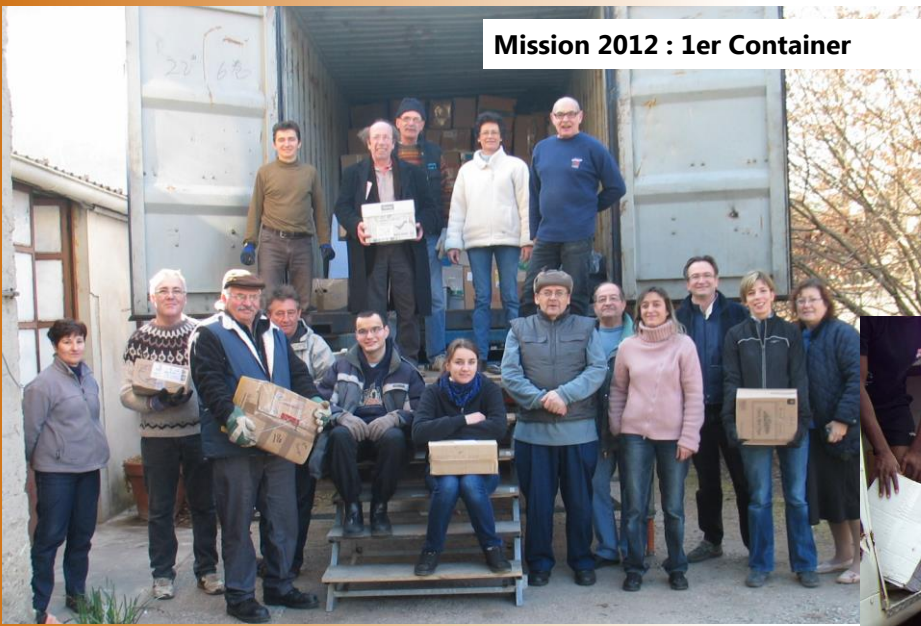
Mission 2012 : 1er Container