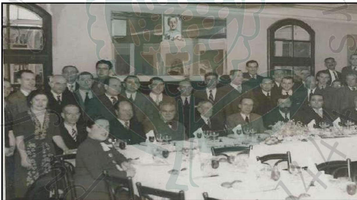
Fotografia de la junta del Gremi de l'any 1945-50

L'ofici de matalasser a Barcelona: un viatge al llarg de la seva història