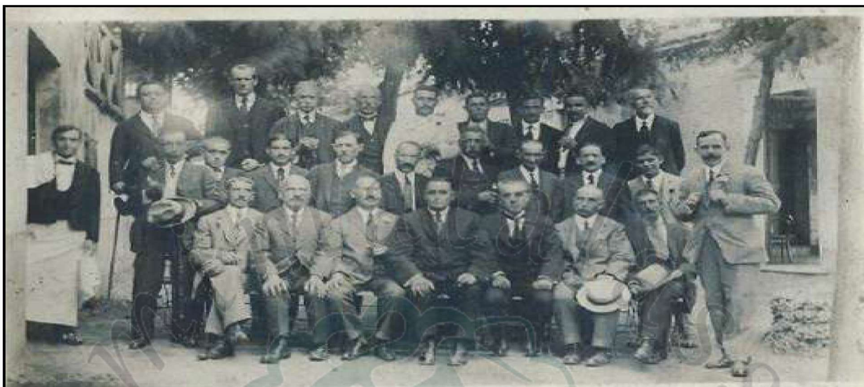
Fotografia de la junta del Gremi de l'any 1930