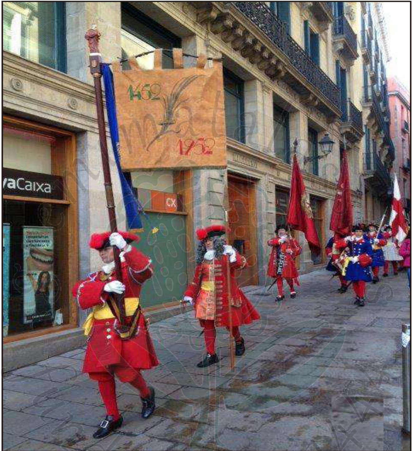
Processo del protocol de lliurament a la Coronela de la bandera del Gremi de Matalassers, que va tenir lloc el dia 14 de desembre

L'ofici de matalasser a Barcelona: un viatge al llarg de la seva història