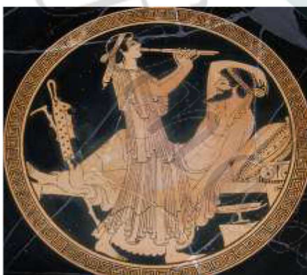
La figura representada s'anomena Comensal i la música, pintat per Kalos, i es tracta d'un fons d'una copa àtica de figures vermelles del 490 a.C. trobat a la localitat de Vulci. 1

Contemporàniament a aquests sarcòfags trobem ceràmiques gregues, concretament les anomenades de figures vermelles. En aquest cas es representen imatges de banquets, on s'aprecien individus esti-