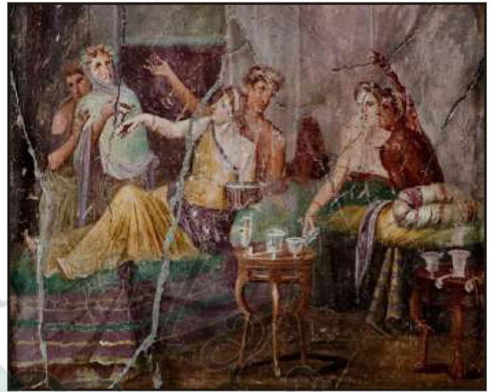
Escena en pintura mural de la Casa dels Castos Amants, Pompeia (Itàlia).

triclinis amb matalassos i coixins a més de tot tipus de teixits 6 . A la literatura llatina, dins de la seva gran varietat temàtica, també trobem molts fragments que ens relaten la vida quotidiana de la seva època, fins i tot la dels soldats.