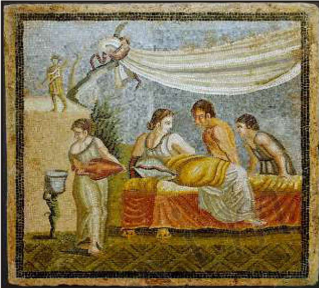
Mosaic de Centocelle (Itàlia). Imatge extreta de: https://commons.wikimedia.org/wiki/File:Roman_mosaic_Love_Scene_-_Centocelle_-_Rome_-_KHM_-_Vienna.jpg