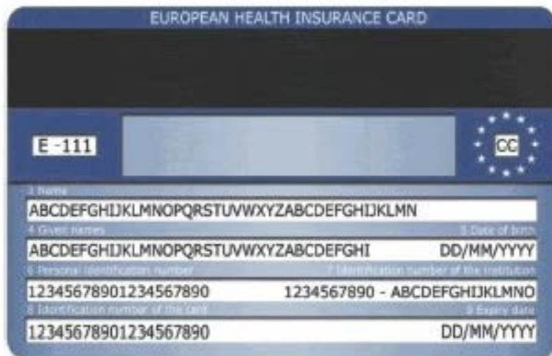
Beispiel für die Rückseite