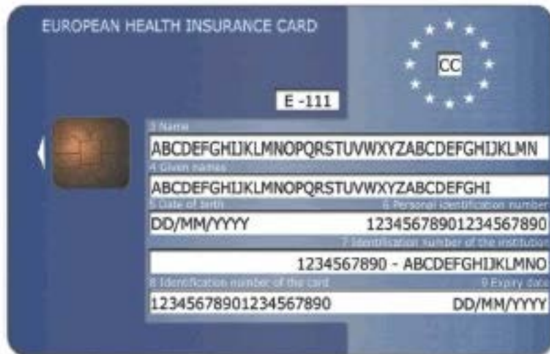
Beispiel für die Vorderseite