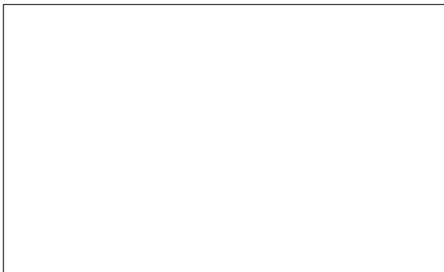
Abbildung 4: Fragebogen für die Ausstellung des Vordrucks A1 (Arbeitnehmer)

→ Bitte senden Sie diesen Fragebogen an: