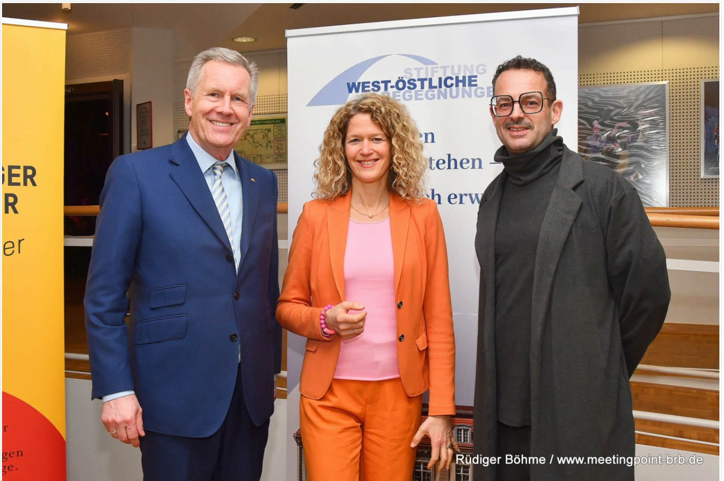
Rüdiger Böhme / www.meetingpoint-brb.de

(/artikelbild/1fEvQnrr/big/146271/bild_1709556905.jpg)