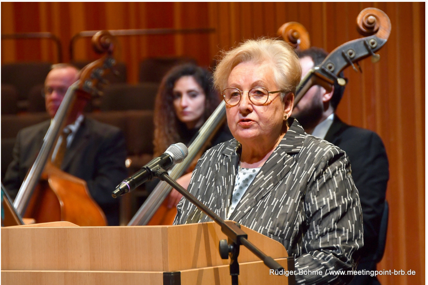
Rüdiger Böhme / www.meetingpoint-brb.de

(artikelbild/1fEvQnrr/big/146273/bild_1709556905.jpg)