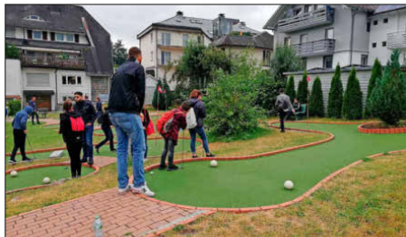
...spielten Minigolf am Titisee,...

Infos rund um den geschichtswettbewerb, die Ausschreibung und das Bewerbungsverfahren gibt es unter www.geschichtswettbewerb.de .