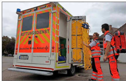
Die auffällig gestaltete Heckpartie mit integrierten Warnleuchten sorgt an der Einsatzstelle für mehr Sicherheit.

Kreis Emmendingen. Neues Outfit, neue Innenausstattung, mehr Leistungsfähigkeit, größere Sicherheit: Im Rettungsdienst des DRK-Kreisverbands Emmendingen hat eine neue Ära begonnen. Vor wenigen Tagen wurde ein neuer Rettungswagen (RTW) offiziell in Dienst gestellt.