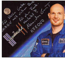
Die begehrte Bestätigungskarte durch Astronaut Alexander Gerst.

Ende Juni beantwortete der deutsche Astronaut Alexander Gerst aus dem All Fragen der Schüler des Werner-Heisenberg-Gymnasiums in Leerkusen. Möglich wurde der Kontakt durch die Organisation „Amateur Radio on the International Space Station“, kurz ARISS, in Zusammenarbeit mit dem Deutschen Amateur