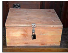
Diese versteckte Schatztruhe gilt es zu finden.