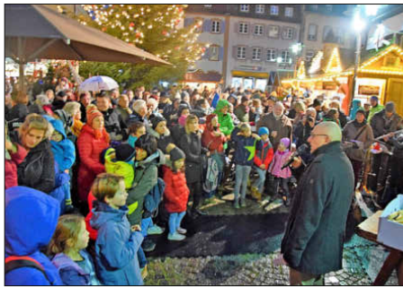
Menschenansammlungen wie diese, müssen in diesem Jahr vermieden werden.

Emmendingen. Weihnachtsmarkt und Eisbahn in der Corona-Zeit? Ist das möglich? Wenn es die gesetzlichen Hygienevorgaben erlauben, dann wird es zum Jahresende tatsächlich ein „Märchenhaftes Weihnachten“ in der Großen Kreisstadt geben. Freilich in etwas anderer und „abgespeckter“ Form. Stadt und beteiligte Akteure setzen alles daran, dass sich das Mittelzentrum ab Ende November wieder in strahlendem Lichterglanz und mit den beliebten Attraktionen präsentieren wird. Die Planungen dazu haben schon vor längerer Zeit begonnen.