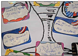
Viele positive Rückmeldungen der Teilnehmer in der Schatzkammer zu finden.