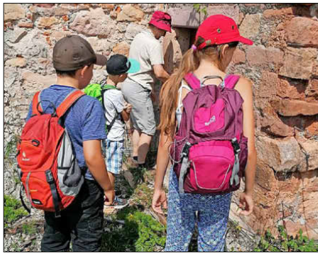
Die Kinder und Jugendlichen inspizierten die Latrine auf der Hochburg,...

Emmendingen. Aufgrund der Corona-Pandemie verzichteten viele Familien auf ihren Sommerurlaub. Langweilig werden muss den Kindern und Jugendlichen deswegen nicht. Die Stadt bot einerseits zwei Wochen Ferienbetreuung an. Andererseits läuft noch das Ferienprogramm mit den nahezu täglichen Aktionen.