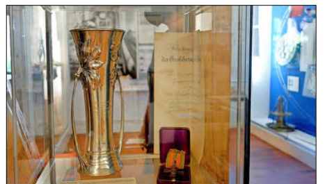
Mit Exponaten wie diesem Pokal im Jüdischen Museum wird die Geschichte ihrer Reisen in „Kunstobjekte im Gepäck“ erzählt.