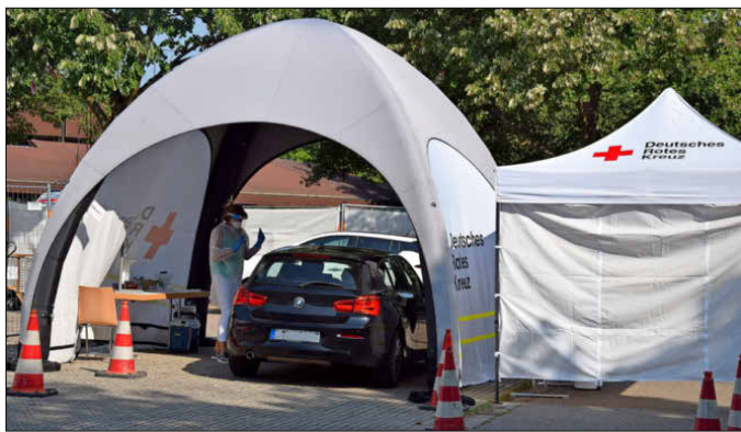
Der Abstrich selbst wird von einem Arzt gemacht. Die Testpersonen können im Fahrzeug sitzen bleiben.

Kölblin ist Kreisbeauftragter für den Notfalldienst der Kassenärztlichen Vereinigung. Aktuell nimmt er auch die Rolle des Pandemiebeauftragten ein. Nach dem Abstrichzentrum am Kreiskrankenhaus und den Corona-Ambulanzen in der GHSE-Halle und in der Köndringer Winzerhalle hat er in Mundingen den Drive-Through auf die Beine gestellt. „Zum Zeitpunkt der Eröffnung waren wir in der Region die ersten“, blickt der Allgemeinmediziner