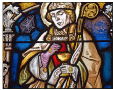
Auch beim Fensterbild des Heiligen Konrad von Konstanz gibt es eine Aufgabe zu lösen.

Emmendingen. Wie viele freistehende Säulen gibt es in der Kirche? Welche Geschichte aus Jesus' Leben ist auf den Bildern dargestellt? Welche Form ist auf den Bodenfliesen zu erkennen? Die Schatzsuche in und rund um die St. Bonifatius-Kirche macht die Teilnehmer auf „rätsel- hafte“ Weise mit dem katholischen Gotteshaus bekannt.