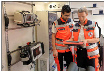
Ergonomisch sinnvoll angeordnet, robust und funktional wurde die Innenausstattung des neuen RTWs gestaltet.

Dieser löst ein Altfahrzeug ab, das nach sechs Jahren Rund-um-die-Uhr-Einsatz ins „zweite Glied“ rückt und als Ersatzfahrzeug weiter vorgehalten wird. Der neue Rettungswagen wurde gemeinsam vom DRK-Landesverband Badisches Rotes Kreuz mit mehreren Rettungsdiensten im Land sowie Spezialisten konfiguriert. Auf den ersten Blick besticht das Fahrzeug, das an der DRK-Rettungswache Emmendingen stationiert ist, durch sein auffälliges „äußeres Auftreten“: Das liegt zum einen an der Lackierung, zum anderen an der Sondersignalanlage. So sind in der Frontpartie insgesamt sechs Blitzleuchten integriert, die dem vorausfahrenden Verkehr das herannahende Notfallfahrzeug signalisieren. In der Heckpartie ist ein spezielles Warnsystem unter anderem mit zusätzlichen Blinkleuchten installiert.