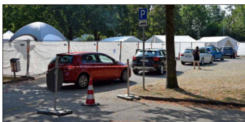
Zwischen ein und zwei Stunden dauert ein Durchlauf. Drei Stationen müssen angesteuert werden.