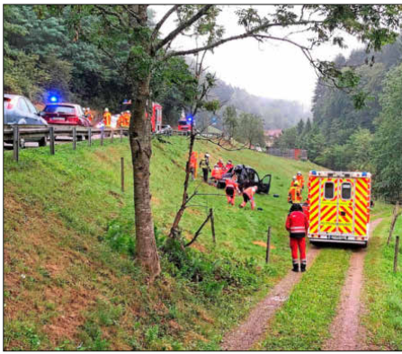
Unfall auf der L 110: Die Feuerwehr musste den eingeklemmten Mann befreien.