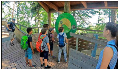
...oder spazierten auf dem Baumkronenweg in Waldkirch.