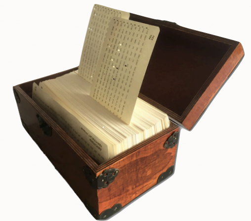
General Analysis Kartenrepertorium

Falls vorhanden, bitte eigene Boger-Literatur mitbringen. Darüber hinaus kann auch vor Ort Literatur zur Verfügung gestellt werden.