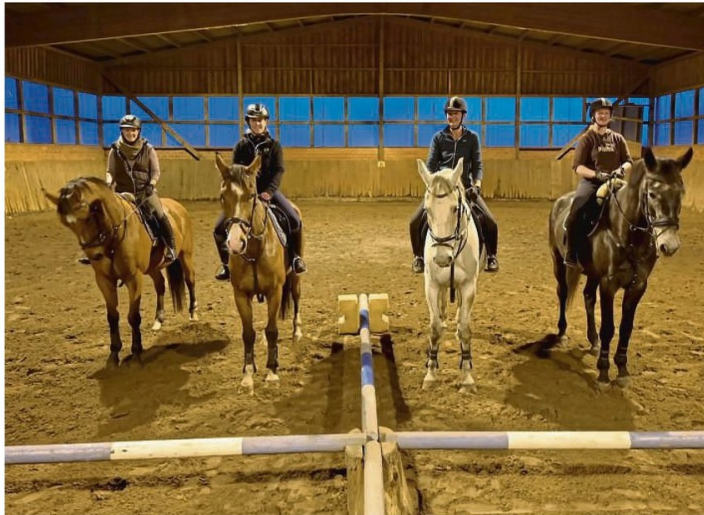
In diesem Jahr gibt es eine Premiere: Das Flutlichtreiten wird nur als Video zu sehen sein.