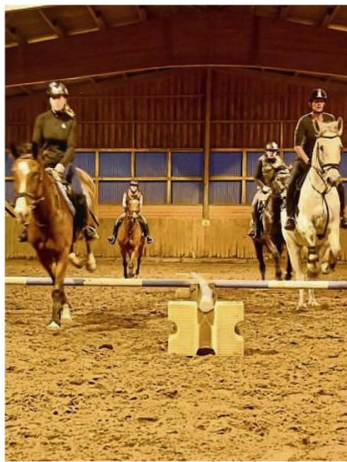
Die Reiter trainierten für das Flutlichtreiten.

Schon lange vor dem zweiten Lockdown hatte der veranstaltende Reitverein (RV)