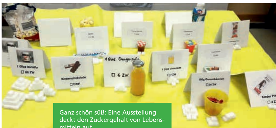
Ganz schön süß: Eine Ausstellung deckt den Zuckergehalt von Lebensmitteln auf.