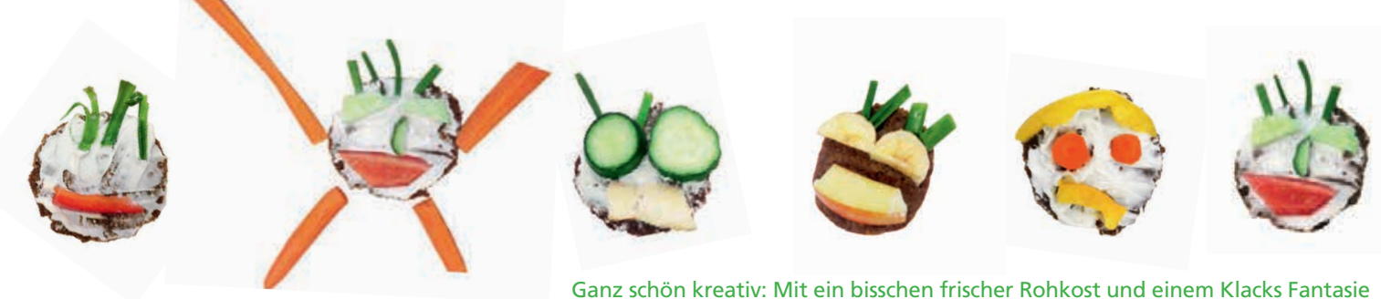
Ganz schön kreativ: Mit ein bisschen frischer Rohkost und einem Klacks Fantasie wird aus jedem Pausenbrot ein lustiges Brotgesicht.