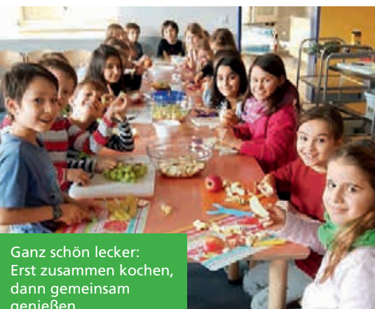
Ganz schön lecker: Erst zusammen kochen, dann gemeinsam genießen.

Über die AG sei es zudem möglich, den Kindern transparent zu machen, was in verschiedenen Speisen enthalten ist, betont die OGS-Leiterin. „Beim Obstsalat etwa verzichten wir auf Kristallzucker und süßen ihn nur mit