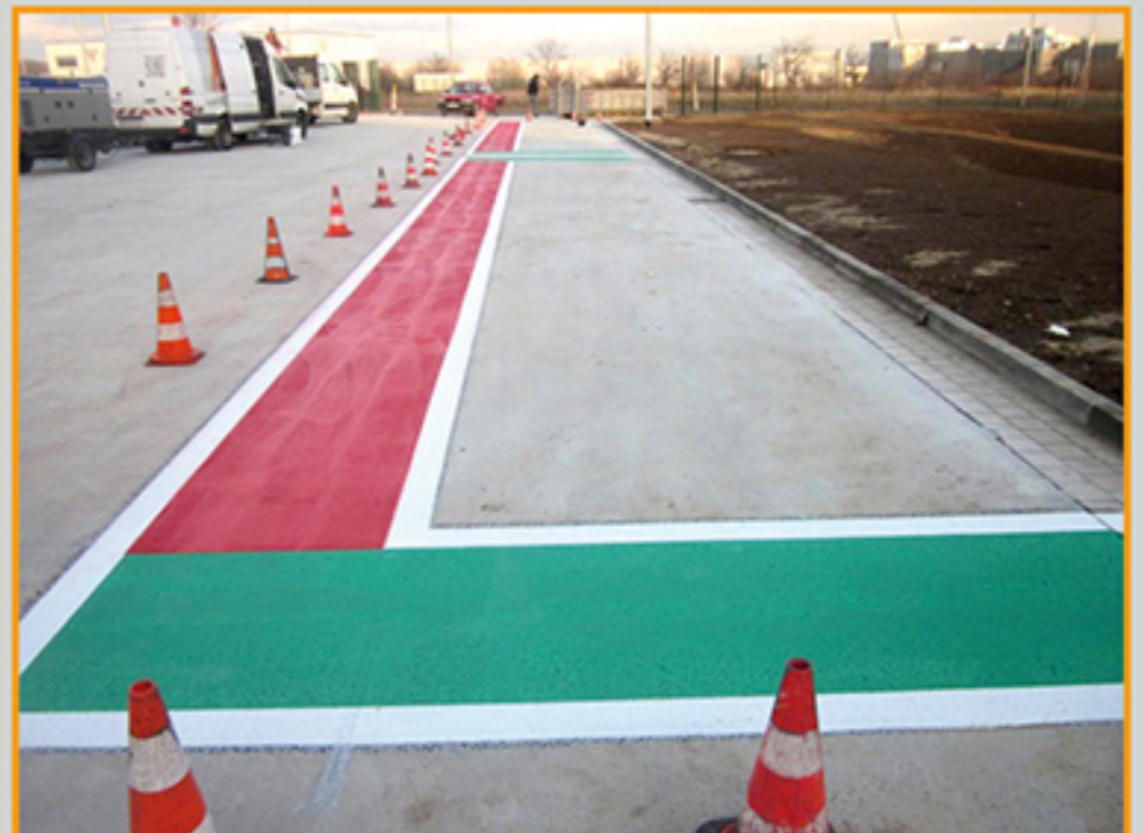
Innen- und Außenmarkierung Hasseröder Brauerei, Werningerode