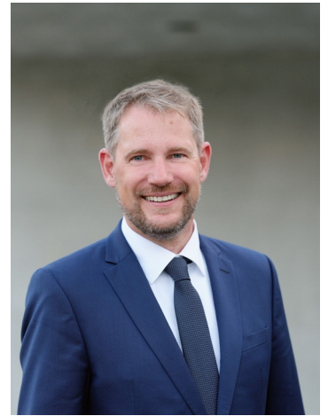
Luca Wilhelm Prayon Landrat des Bodenseekreises

Für Ihre berufliche Zukunft, zu der Sie heute vielleicht Ihren ersten Grundstein legen, wünsche ich Ihnen alles Gute. Noch ein Hinweis in eigener Sache: Suchen Sie eine Ausbildung mit vielseitigen Aufgaben und Aussicht auf einen sicheren Arbeitsplatz? Arbeiten Sie gerne im Team, gehen Dinge aktiv an und haben Spaß im Umgang mit Menschen? Dann besuchen Sie uns am Stand des Landratsamtes Bodenseekreis – mit unseren über 20 Ämtern haben wir auch für Sie das Richtige dabei.