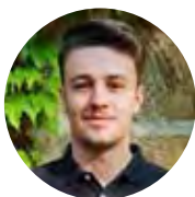
Calvin Sixt Vertrieb