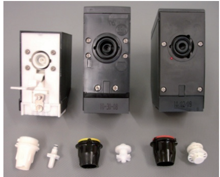
Abb. 5: Zur gründlichen Reinigung zerlegte Zapfhähne für Bier (links) und Postmix (rechts)