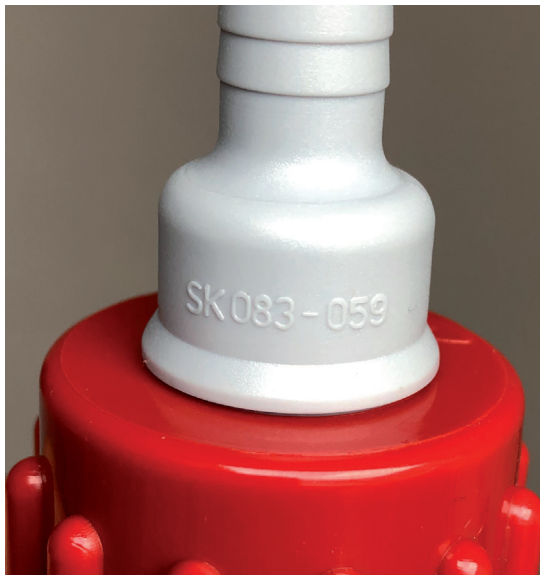
Abb. 1: Bauteil mit SK-Kennzeichnung