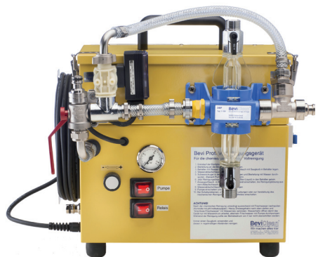
Abb. 10: Mobiles chemisch-mechanisches Reinigungsgerät

Beispielhafte Reinigungsgeräte für chemische und chemisch-mechanische Reinigung zeigen Abb. 9 und 10.