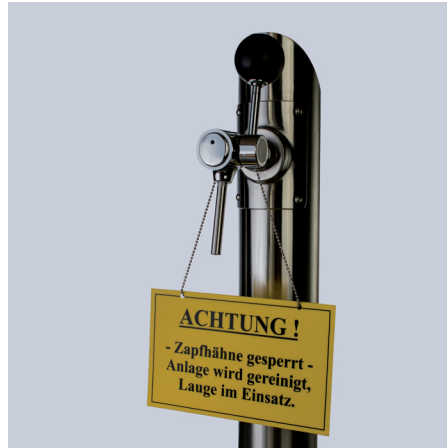
Abb. 8: Warnhinweis am Zapfhahn während der Reinigung

Achtung: Falls während der Reinigung die Entnahme von Reinigungsmitteln über die Zapfarmatur möglich ist, muss an dieser Stelle ein geeigneter Warnhinweis für die Dauer der Reinigung angebracht sein (Abb. 8).