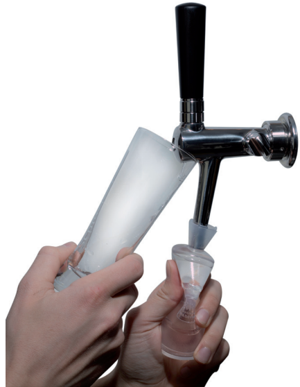
Abb. 2: Spülen des Hahnauslaufes und der Luftbohrung mittels Reinigungsball

Bitte führen Sie alle Arbeiten nur mit gründlich gewaschenen Händen durch.