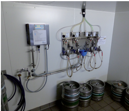
Abb. 9: Automatisches chemisches Reinigungsgerät für Leitungen (Dosiervorrichtung und Steuereinheit)

Wichtig: Nach jedem Reinigungsprozess ist mit genügend Trinkwasser nachzuspülen, bis alle chemischen und mechanischen Rückstände beseitigt sind.