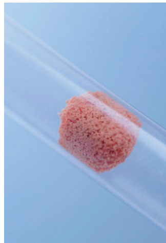
Abb. 12: Gepresste Schwammkugel im Leitungssystem