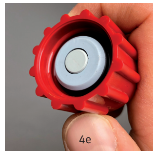
Abb. 4a: Reinigen der Steckverbindung in sauberem, warmem Trinkwasser Abb. 4b-4c: Desinfizieren des Zapfkopfes (4b), der Steckverbindungen (4c) der Behälteranschlussteile (4d), Abbildung eines Bag-in-Box-Anschlusses (4e)