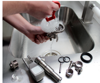
Abb. 6: Links: zerlegter Zapfkopf, rechts: Reinigung eines Zapfkopfes für Bier