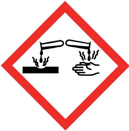
Abb. 13: Kennzeichnung eines ätzenden Stoffes

Sie dürfen niemals Reinigungsmittel miteinander mischen, hierbei können giftige Gase (z. B. Chlorgas) entstehen oder ätzende Flüssigkeiten unkontrolliert spritzen.