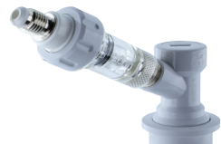
Abb. 7: links: Zapfkopf für Bier, Mitte: zerlegter Zapfkopf für Bier, rechts: Behälteranschluss für Schankgas mit Rückschlagsicherung

Der bewegliche Teil der Hinterdruckgasleitung (Abb. 7) kann durch Getränke- oder Grundstoffreste verunreinigt werden. Bei er-