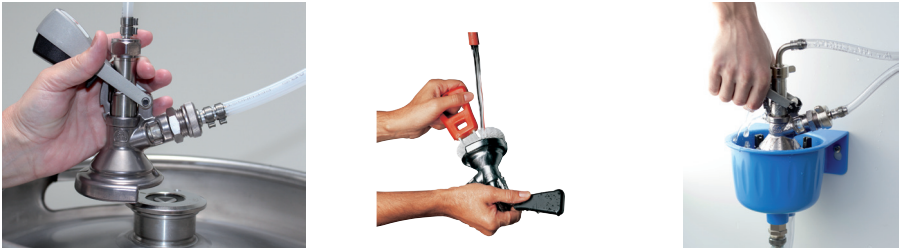
Abb. 3: links: kritischer Bereich (Anschluss des Zapfkopfs an den Getränkebehälter), Mitte: Reinigung des Zapfkopfes mit Trinkwasser und Bürste, rechts: Reinigung des Zapfkopfes mit einer Zapfkopfdu- sche Spülen des Hahnauslaufes und der Luftbohrung mittels Reinigungsball