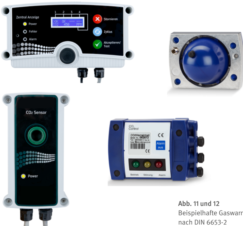
Abb. 11 und 12 Beispielhafte Gaswarnanlagen nach DIN 6653-2