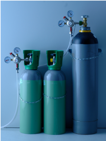
Abb. 3 Entleeren und Bereithalten von Druckgasflaschen

Abweichend von Abschnitt 5.2.2.2 dürfen in Räumen unter Erdgleiche, die eine Grundfläche \leq 12 \text{ m}^2 haben und die allseitig mit festen öffnungslosen Wänden von mehr als 1,5 m Höhe umgeben sind, bis zu zwei Druckgasflaschen mit einem maximalen Fassungsvermögen von je 14 l bzw. 10 kg Füllgewicht zum Entleeren angeschlossen werden.