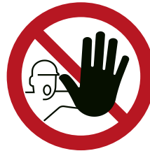
Abb. 6 Verbotsschilden D-P006 „Zutritt für Unbefugte verboten“