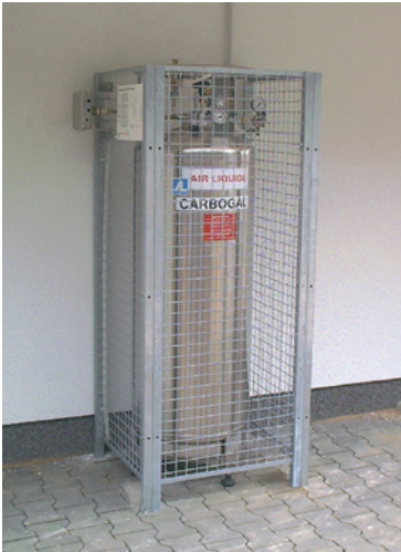
Abb. 5 Aufstellungsbeispiel für einen stationären Druckbehälter