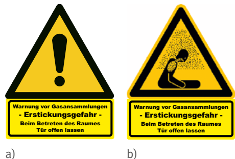
Abb. 1 Warnzeichen: a) W001 „Allgemeines Warnzeichen“ b) W041 „Warnung vor Erstickungsgefahr“ mit Zusatzschild „Warnung vor Gasansammlungen – Erstickungsgefahr“

An den Zugängen zu allen Räumen, in denen eine Gefährdung durch ausströmende Schankgase entstehen kann, sind Warnzeichen gemäß Abbildung 1a oder 1b deutlich sichtbar und dauerhaft anzubringen. Hinsichtlich der Größe und Kennzeichnung siehe Technische Regeln für Arbeitsstätten „Sicherheits- und Gesundheitsschutzkennzeichnung“ (ASR A1.3).