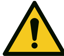
Abb. 7 Warnschilden W001 „Allgemeines Warnschild“