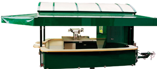
Abb. 10 Beispiel eines Ausschankwagens mit begehbarem Kühlraum und integrierter Getränkeschankanlage