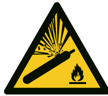
Abb. 2 Warnzeichen W029 „Warnung vor Gasflaschen“

Aufstellungsräume für zum Entleeren angeschlossene Druckgasflaschen sind