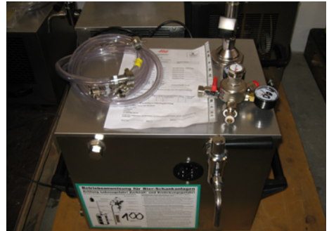
Abb. 9 Beispielhafte nicht verwendungsfertige Getränkeschankanlage

Maßnahmen zum Personenschutz erforderlich, zum Beispiel: