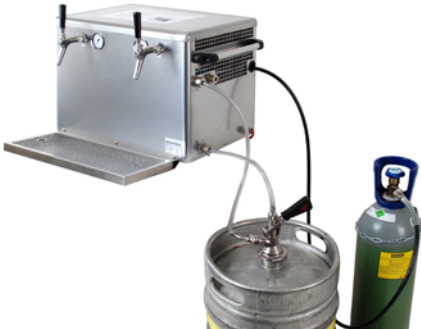
Abb. 8 Beispielhafte verwendungsfertige Getränkeschankanlage